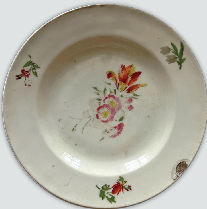
Fot. 2. Talerz, nr inw. 76059 MNW

Dla pełnej kwerendy potrzebny jest dostęp do obiektów w zbiorach muzeów polskich i ukraińskich, co w obecnej chwili nie jest możliwe z wielu względów.