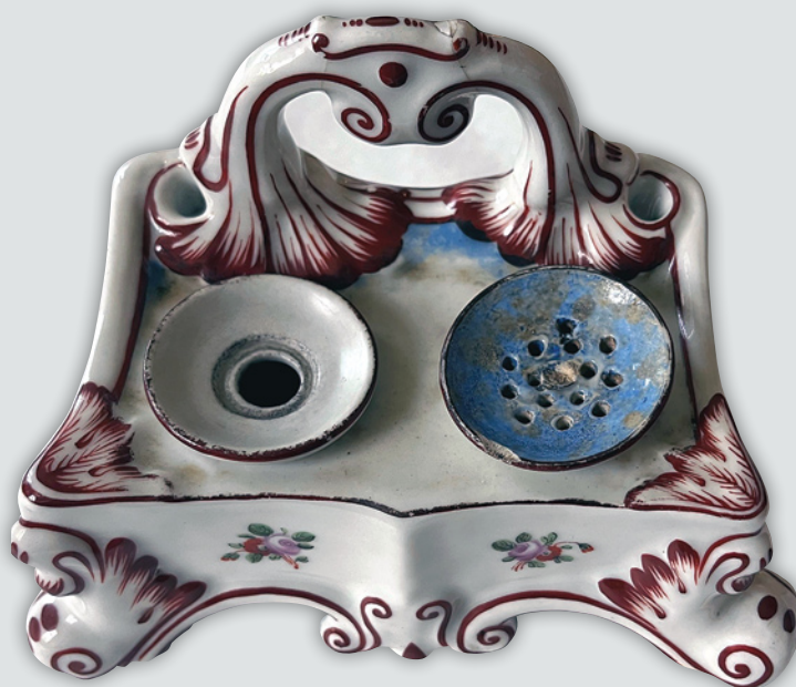
Fot. 3. Kałamarz, nr inw. SZC 1779/a-c MNW

Talerze zarówno te w zbiorach kieleckich jak i zachowane w MNW zdobione są dość typowymi dla tego czasu dekoracjami. Podstawowy wzór na bukiet kwiatowy w lustrze i trzy pojedyncze kwiaty rozłożone symetrycznie na kołnierzu. Taki typ dekoracji powtarzał się w pierwszej i drugiej ćwierci XIX wieku. Jej pierwowzorów można poszukiwać w Miśni w latach 30. i 40. XVIII wieku, kiedy to powstały pierwsze dekoracje z wykorzystaniem dość wiernie odwzorowanych rodzimych, europejskich gatunków kwiatów 27 , w odróżnieniu od inspirowania się dekoracjami wschodnioazjatyckimi. Szczególnie często malowano w lustrze kompozycje z tulipanów, prymulek, róż i goździków 28 . Podobne dekoracje stosowano również w innych wołyńskich wytwórniami, które często różniły się między sobą niewielkimi szczegółami w tonacji farb naszkliwnych, czy detalami w dekoracji. Do ciekawszych przykładów należy kałamarz z dwoma pojemnikami – na atrament i piasek w kształcie nawiązującym do trapezowatej kanapy, wspartej na wolutowych nóżkach.