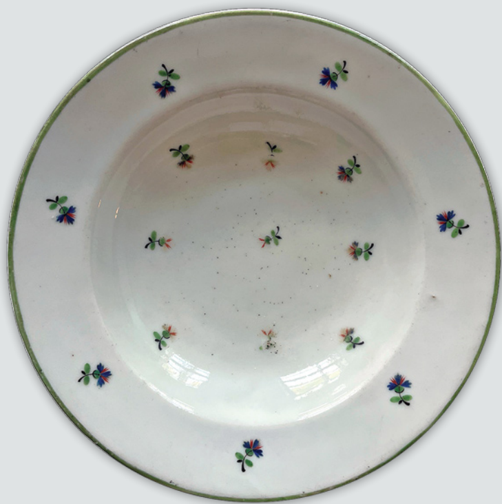
Fot. 1. Talerz, nr inw. SZC 2918 MNW