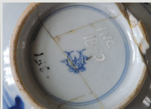
Fot. 3 Podszkliwny znak podwójne ryby spięte pierścieniem umieszczony na spodzie miski na ryż, okres Kangxi, ok. 1660-1722, Elbląg, ul. Rybacka 6