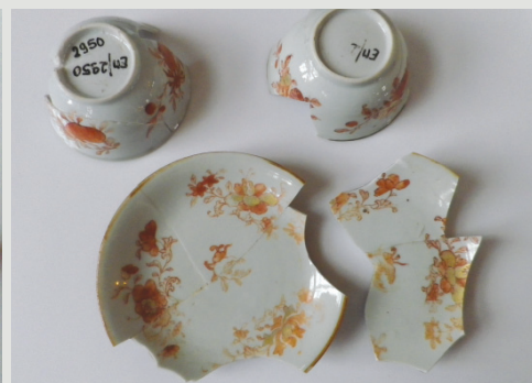
Fot. 7. Czarki i spodki z dekoracją typu imari rouge-de-fer and gold, okres Kangxi, 1710-1720, Elbląg, ul. Rzeźnicka 3