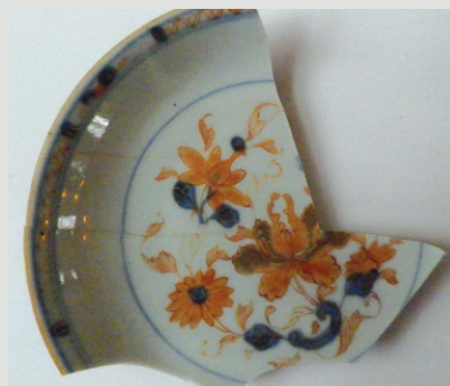
Fot. 6a. Spodek o dekoracji kwiatowej, typ chińskie imari, przełom okresów Yongzheng i Qianlong, ok. 1735-1745, Elbląg, ul. Bednarska 16