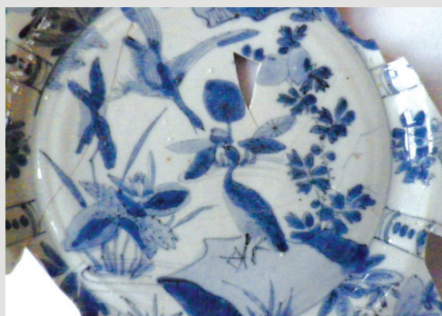
Fot. 1 Talerz typu kraak porcelain z pejzażem nadwodnym, okres Wanli, ok. 1610-1620, Elbląg, ul. Św. Ducha 29