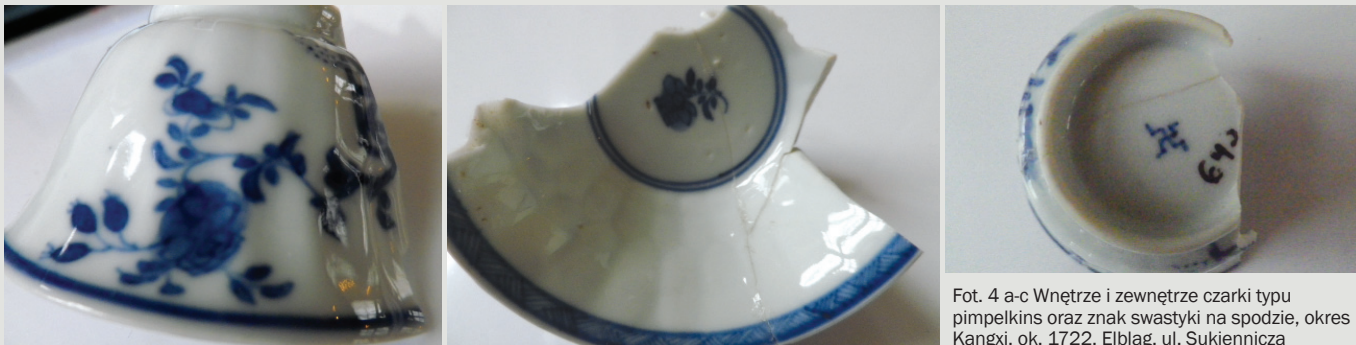
Fot. 4 a-c Wnętrze i zewnątrz czarki typu pimpelkins oraz znak swastyki na spodzie, okres Kangxi, ok. 1722, Elbląg, ul. Sukiennicza

Końierz talerza podzielony jest na osiem szerszych i tyle samo bardzo wąskich, fasetowanych rezerw. W szerszych rezerwach naprzemiennie występują: kwiat artemizji - słodkiego piołunu (Qing Hao), być może stylizowany motyw grzyba Lingzhi i owad (motyl/Hu Tieh). Umieszczony w rezerwach motyw motyla odnosi się tu do znaczenia radości i szczęścia małżeńskiego a grzyb symbolizuje długowieczność. Natomiast słodki piołun, zioło które było lekiem na malarię, było również w Chinach emblematem piękna kobiecego ( Artemisia annua ; Eberhard 1996, s. 122-124). Na węższych rezerwach kołnierza naczynia powtarzają się centrycznie rozchodzące się kropki (koraliki). Rewers talerza jest także dekorowany podszkliwnie kobaltem. Fasety są okonturowane. W węższych umieszczono stylizowany motyw grzyba Lingzhi, a w szerszych rozetki z pięciu koralików.