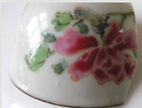
Fot. 5. Czarka dekorowana w stylu famille rose, okres Qianlong ok. 1735-1745, Elbląg, ul. Rzeźnicka 3