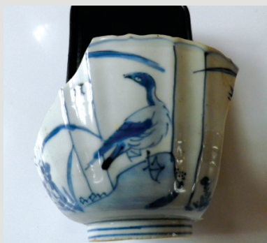
Fot. 2 Czarka typu kraak porcelain z motywami ptaków, okres Wanli, ok. 1610-1620, Elbląg, ul. Bednarska 22