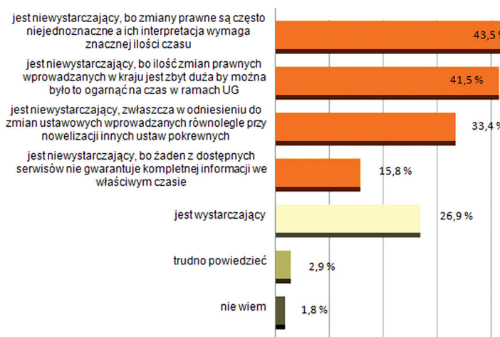
Jak władze gminy oceniają stopień pozyskiwania wiedzy o wprowadzanych w życie nowych aktach prawa i sposobach ich stosowania?