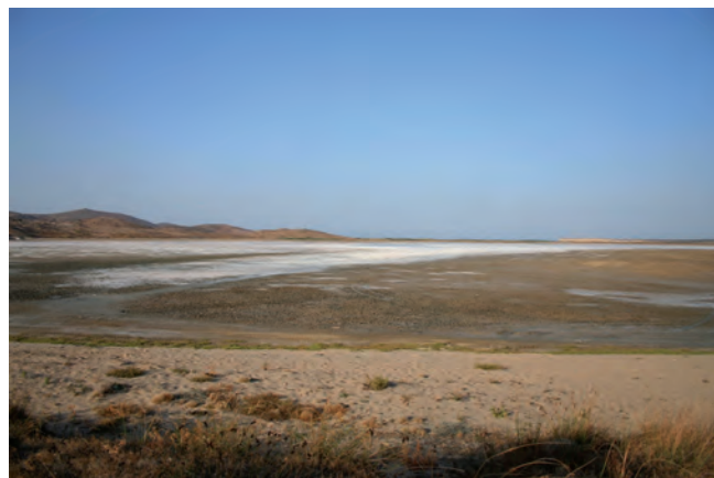
Fig. 12. Aydıncık – therapeutic mud of the salty lake, phot. M.W. Lorenc • Aydıncık – terapeutyczny muł słonego jeziora, fot. M.W. Lorenc

Going round the island further to the east, we will come across a place (although it can be easily overlooked) of a great historical value in the area of Kokina, 18 km away from Merkez. On a completely uninhabited and treeless ground there is a big piece of conglomerate with two tombs hewn out in it (Fig. 11). This object is dated back to the time of the Roman Empire.