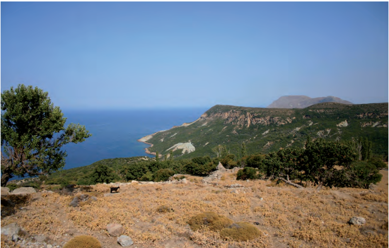
Fig. 8. Eski Bademli – panorama of the northern coast built from andesites (first and third layer) and sandstones (second layer) • Eski Bademli – panorama północnego wybrzeża zbudowanego z andezytów (pierwszy i trzeci plan) i piaskowców (drugi plan)

Characteristic landscapes in the southern part of the island are vast, sandy beaches stretching to the east of Uğurlu (Fig. 10).