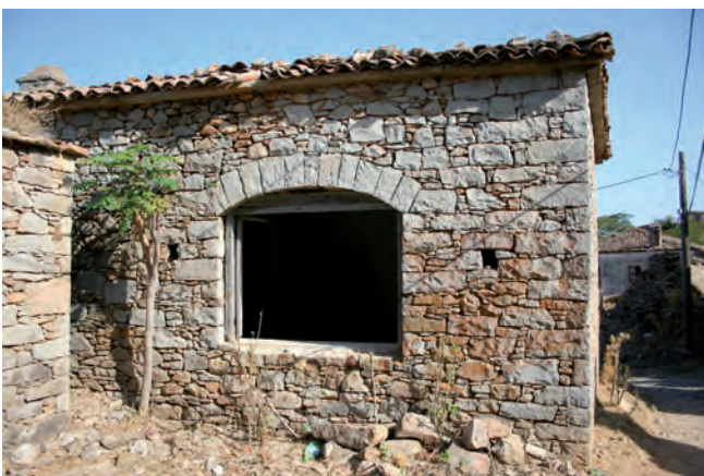
Fig. 5. Dereköy – building made from well fit blocks of andesite, phot. M.W. Lorenc • Dereköy – budynek wykonany z dobrze dopasowanych bloków andezytu, fot. M.W. Lorenc

The sedimentary formation of clastic rocks mainly consists of sandstones, slates and conglomerates which are revealed in the central part of the island. These sediments were deposited on limestones after marine regression in the Eocene. Cross stratification and current structures clearly visible in these rocks (including thick conglomerates) indicate sedimentation in the river or delta environment. Thicker horizons of lignite in this formation also support the fluvatile paleoenvironment. The thickness of this whole clastic formation reaches up to 1 km.