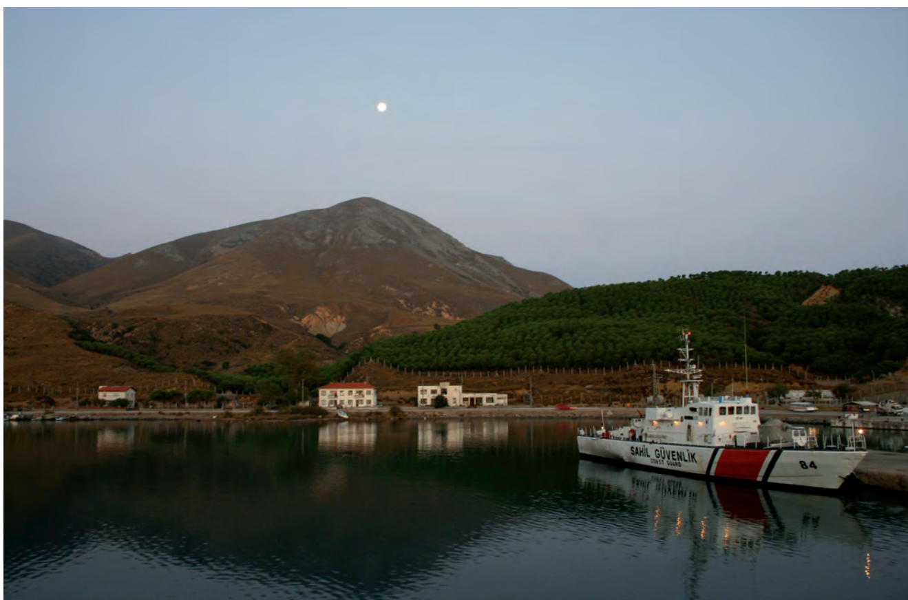
Fig. 2. Kuzulimanı – ferry harbour at dawn • Kuzulimanı – przystań promowa o świcie

The oldest history of Gökçeada has not been discovered entirely yet. Archaeologists pin high hopes on completing excavations which have been carried out systematically from 1996 on Yeribademli Höyük hill. The discoveries carried out up to now indicate that colonization here dates back to the time of Troy I but there are traces of older colonization dated back to 3000 BC. At the same time excavations carried out on Crete in Knossos have confirmed that the old Greek name of the island – Imvros was known in the second millennium BC.