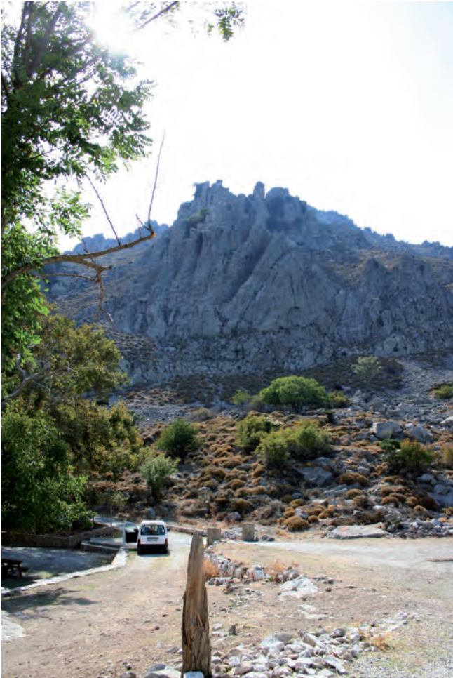
Fig. 4. Eski Bademli – andesitic dome, phot. M.W. Lorenc • Eski Bademli – kopuła andezytowa, fot. M.W. Lorenc

Nummulitic lenses of 5cm thickness are visible to the naked eye. Limestones particularly rich in nummulites ( Nummulites perforatus , Nummulites irregularis ) become violet. Locally it is also possible to find big oyster fossils ( Ostrea gigantea ) of diameter up to 15 cm in limestones. At the south-east border of the limestone area there are claystones and marls of thickness up to 400 m (Akartuna, 1980).