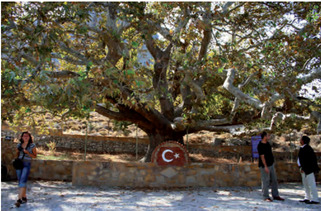
Fig. 7. Eski Bademli – plane tree – 630 years old natural monument • Eski Bademli – platan – pomnik przyrody liczący około 630 lat

There are seven old trees registered as monuments of nature. All of them are plane trees, the youngest ones are 180 years old and others are 400 years old. The oldest tree (Fig. 7) is