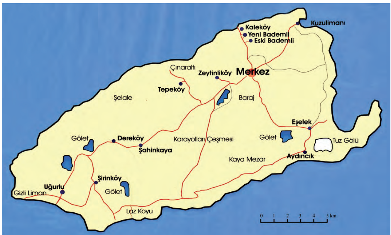
Fig. 1. Map of the Gökçeada (according to Gökçeada, 2002) • Mapa wyspy Gökçeada (wg Gökçeada, 2002)

Abstract: Gökçeada is the biggest of all Turkish islands situated on the Thracian Sea about 20 km west of the Gallipoli Peninsula. Archaeological discoveries have so far indicated that colonization on this island dates back to 3000 BC. Currently, about 8300 people live on Gökçeada, including about 250 inhabitants of Greek origin. The diversity of the island's geological structure affects its rich relief and area colouring. Cliffs on the northern coast and beaches on the southern one, high mountains and deep canyons in the central part of the island attract fans of solitude, diving and nature. Monuments from the time of the Roman Empire are rare on the island. One of them is a huge rock with two tombs hewn out in it. It is located in a completely uninhabited and treeless area.