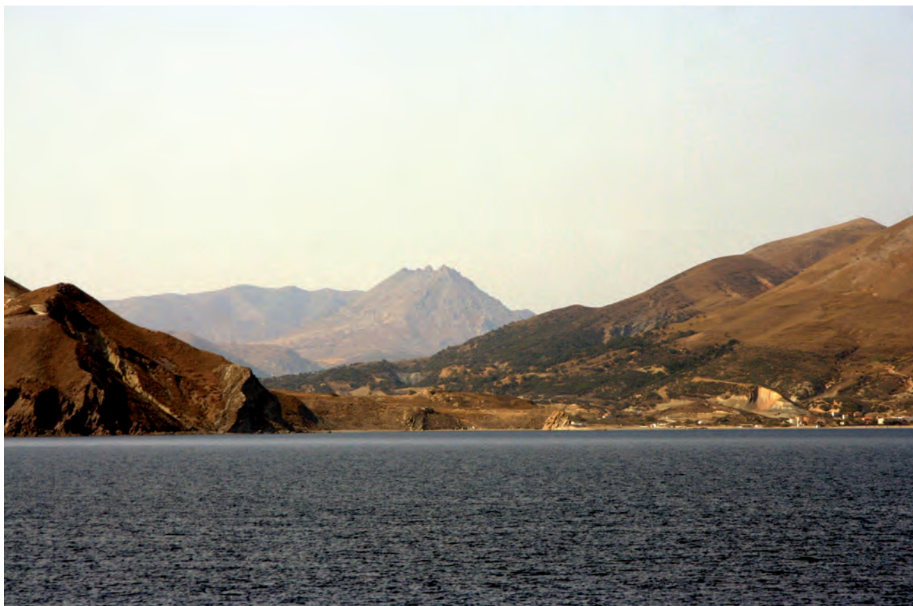
Fig. 6. Kuzulimanı – rocky coast of sandstones with andesitic dome in the background • Kuzulimanı – skaliste piaszkowcowe wybrzeże z andezytową kopułą w tle

When approaching Gökçeada by ferry, the place may seem an inhospitable and rocky island. In reality, it is beautiful and green in a large part. A visit to Gökçeada leaves unforgettable impressions.