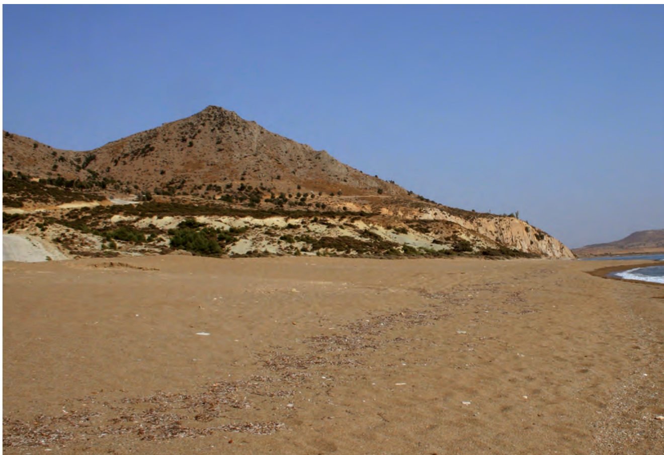
Fig. 10. Uğurlu – beaches of the southern coast, phot. M.W. Lorenc • Uğurlu – plażowe południowe wybrzeże wyspy, fot. M.W. Lorenc