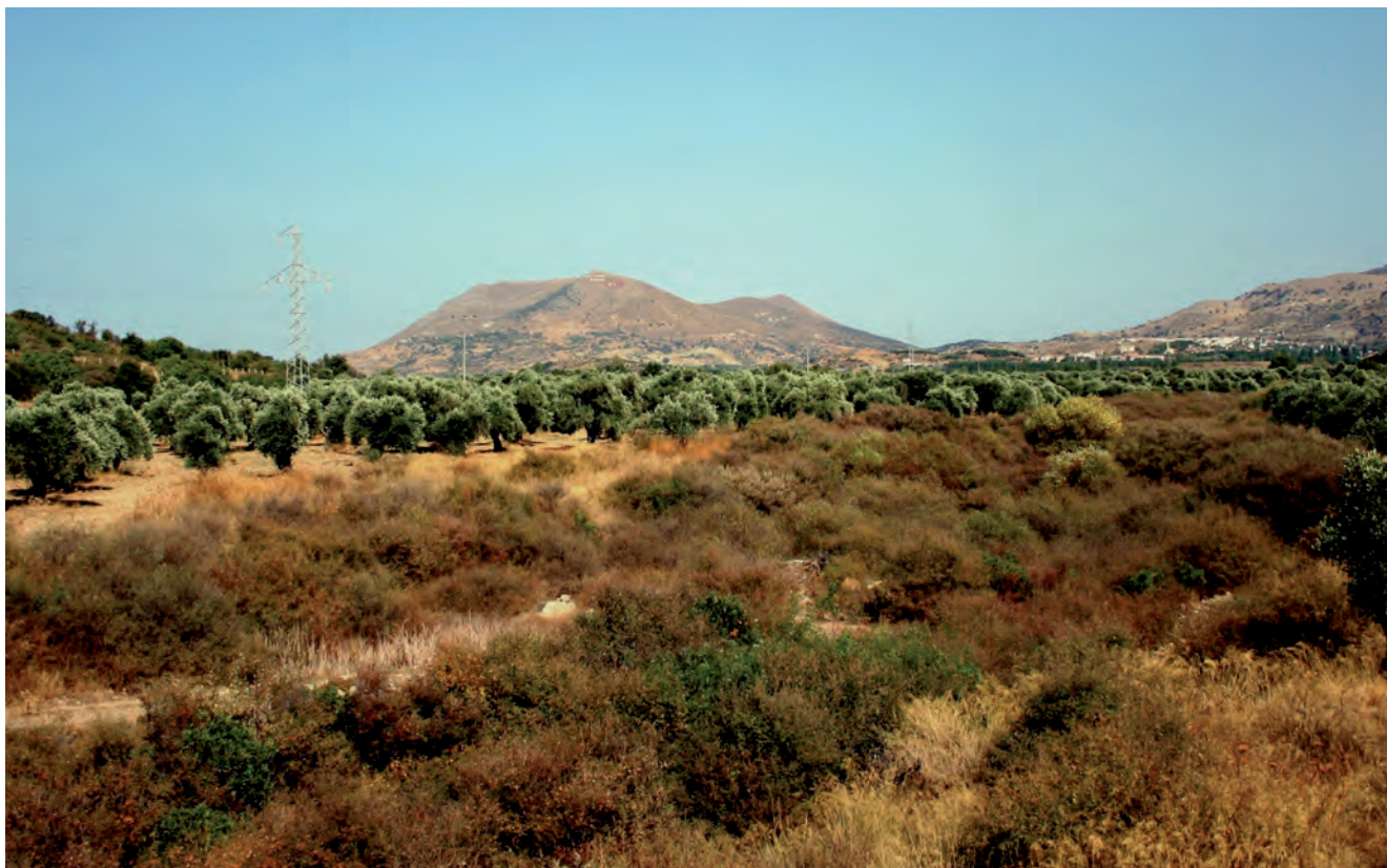
Fig. 9. Zeytinliköy – olive grove of several years, phot. M.W. Lorenc • Zeytinliköy – od wielu lat prowadzona plantacja drzew oliwnych, fot. M.W. Lorenc