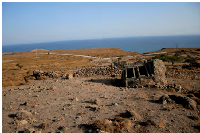
Fig. 11. Kokina – conglomerate block with two tombs from the time of the Roman Empire • Kokina – zlepieńcowy blok z podwójnym grobowcem z czasów rzymskich