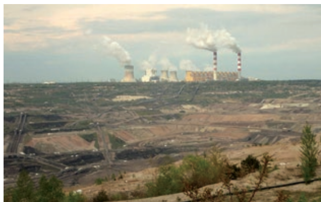
Fot. 2. Odkrywka Bełchatów w 2016 roku

Pole Bełchatów jest eksploatowane od początku istnienia Kopalni. Znajduje się bezpośrednio przy Elektrowni, a jego powierzchnia wynosi około 3200 ha. Pole Bełchatów jest największym złożem węgla brunatnego w Polsce. Znajduje się w nim około 60% całkowitych zasobów zagłębia bełchatowskiego. Zasoby bilansowe Pola Bełchatów są szacowane na około 136 mln ton, z czego około 92 mln ton to zasoby przemysłowe. W 2014 roku wydobycie węgla z Pola Bełchatów wyniosło 26,64 mln ton, co stanowiło 41,6% krajowego wydobycia węgla brunatnego [8,11,13].