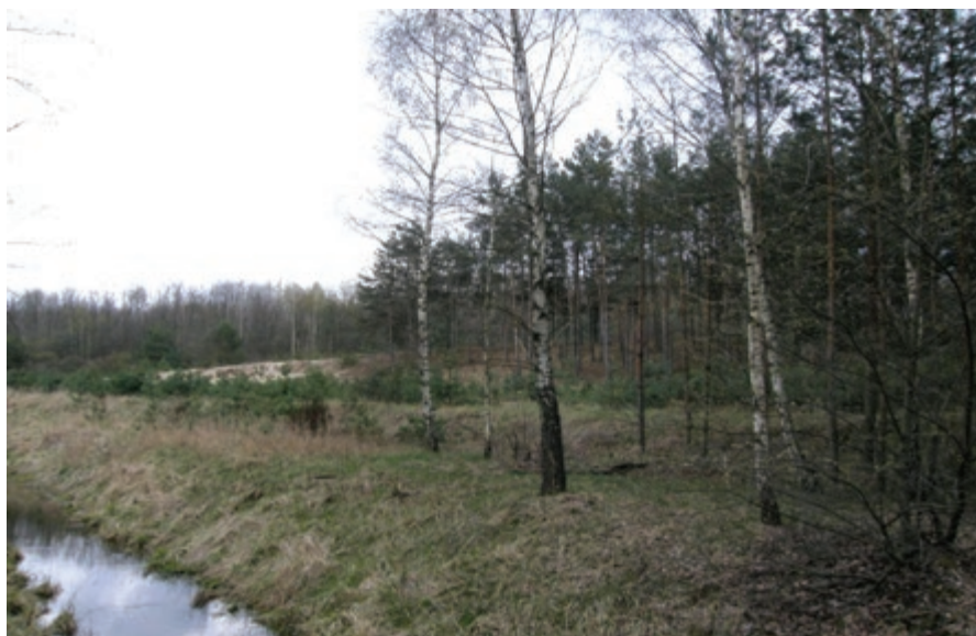
Fot. 3. Składowisko Bagno Lubień

wschodniej części Pola Bełchatów . Jest to składowisko suche, na którym magazynuje się popiół razem z nadkładem kopalnianym. Składowisko pracuje w układzie odpopielania pneumatycznego, a popiół jest dostarczany przenośnikami taśmowymi. Łącznie trafia tam 70% wszystkich odpadów paleniskowych wytwarzanych w Elektrowni. Od początku eksploatacji do 2000 roku zdeponowanych zostało na tym składowisku 12,9 mln m 3 popiołów, zaś dalsze składowanie będzie możliwe przez cały czas trwania eksploatacji Pola Bełchatów [17,19].