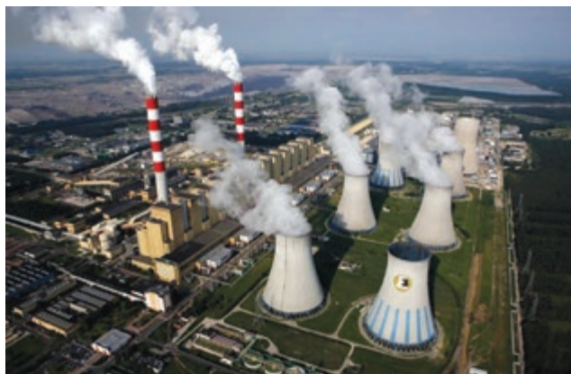
Fot.1. Elektrownia Bełchatów [4]

każdego bloku energetycznego o 10 MW oraz zmniejszenie jednostkowego zużycia paliwa na każdym z nich o około 3%. Tym samym doszło do zwiększenia zainstalowanej i osiągalnej mocy Elektrowni do 4440 MW [2,3].