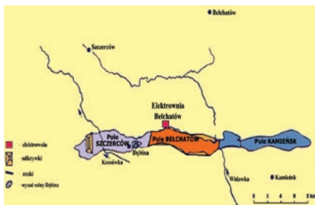
Rys. 1. Położenie złóż węgla brunatnego KWB Bełchatów [11]

Powstanie Kopalni Bełchatów zapoczątkowało odkrycie w 1960 roku w regionie bełchatowskim pokładów węgla brunatnego. Prowadzone następnie przez blisko 15 lat badania potwierdziły występowanie oraz znaczącą pod względem przemysłowym zasobność pokładów węgla brunatnego na tym obszarze. W 1975 roku rozpoczęto odwadnianie złoże oraz instalację koparki nadkładowej. W roku 1977 rozpoczęło się zdejmowanie nadkładu, natomiast pierwsze tony węgla w KWB Bełchatów zostały wydobyte w 1980 roku [5,8].