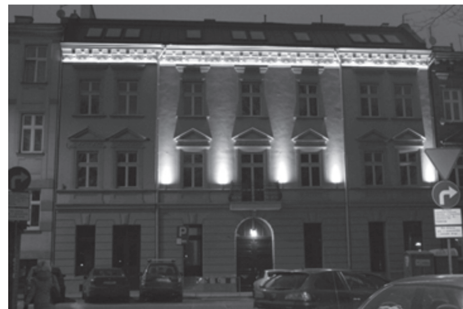
il. 16. Budynek przy ul. Topolowej 8; widok iluminacji elewacji kamienicy w 2017 r. / building at Topolowa 8 Street, view of the illumination of the facade of the building in 2017

Elevation at Topolowa 8 Street is an example of the illumination of the facade of a tenement house. The building has a seven-sided front facade, whose renovation was carried out according to a design