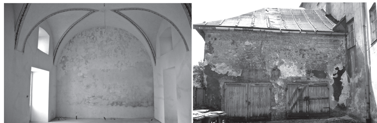
il. 4. Po lewej, wnętrze byłej kaplicy nagrobnej z XVIII w. – obecna część apartamentu; il. 5 po prawej, widok na byłą kaplicę przed przystąpieniem do prac w 2012 r. / il. 4 on the left, the interior of the former funerary chapel from the XVIII-th century – the present part of the apartment. ill. 5 on the right, view of the former chapel before commencing work in 2012

XIX-th century chapel, located in the corner of Koletek Street and Sukiennicza Street, after the de-