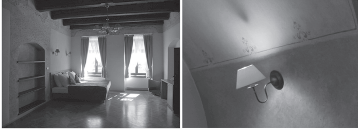
il. 6. Po lewej, wnętrze kaplicy XIX-wiecznej zlokalizowanej w narożniku ul. Koletek i ul. Sukienniczej; il. 7 po prawej, detal złączenia na drewnianej pseudokopule / ill. 6 on the left, the interior of the XIX-th century chapel located on the corner of Koletek Street and Sukiennicza Street, ill. 7 on the right detail of the gilding on a wooden pseudo copula

Kaplica XIX-wieczna, zlokalizowana w narożniku ul. Koletek i ul. Sukienniczej, po desakralizacji, od ok 1950 roku 3 pełniła funkcję sali gimnastycznej. Prywatny inwestor zaaranżował w tym miejscu „Apartament Królewski”. Wnętrze sali o głębokości 12,17m i wysokości 11,24 m, zbudowano na planie ośmiobocznym. Pomieszczenie bogato dekoruje polichromia z przedstawieniami ornamentalnymi i figuralnymi z lat 20. lub 30. XX wieku w ciemnych odcieniach ze złoceniami 4 . Pomieszczenie doświetla pięć witraży. Witraże ułożono naprzemiennie, trzy rozety o średnicy 1,4 m wypełnione szkłem barwionym oraz prostokątne, zakończone łukiem odcinkowym o wymiarach 2,47 m na 5,95 m, w górnej partii wypełnione szkłem barwionym, w dolnej szkłem bezbarwnym. Ślusarka okienna zlokalizowana jest na ścianie z absydą oraz na ścianach bocznych, okalających niegdyś strefę sacrum. Cała kompozycja została przemyślana i zakomponowana tak, by podkreślać funkcję liturgiczną.