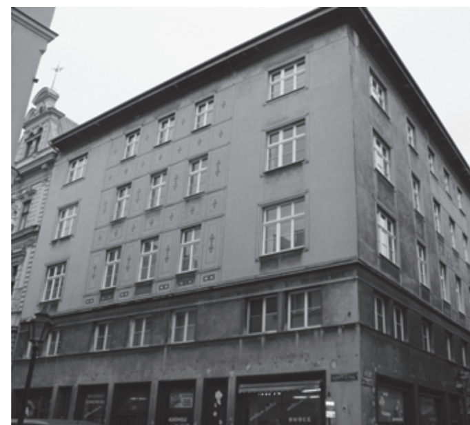
il. 12. Kamienica przy ul. św. Tomasza/ ul. Szpitalnej 11 / building at Św.Tomasza Street / Szpitalna 11 Street il. 13. Kamienica przy ul. św. Tomasza/ ul. Szpitalnej 11; detal mozaiki wokół stolarki okiennej / townhouse at Św. Tomasza Street / Szpitalna 11 Street, mosaic detail around the windows

The corner building at Św.Tomasza Street /Szpitalna 11 Street (ill. 12) was designed by Wacław Krzyżanowski. The building facades are richly decorated, however we can see a division between the residential and commercial portions. In the commercial portion on the ground floor, there is a series of wooden shop windows with metal, copper, repusoeed in geometric patterns, framed with shutters. From the Św. Tomasza street side, it has two portal entryways made of artificial stone, which are richly decorated with floral motifs. The level of the first floor was highlighted by the use of cornices underlined twitch golden mosaics made of terazzo. In addition, at the second, third and fourth floors in spaces in-between the window, we find mosaic artwork made up of geometric pattern in the colors of gold, white, black and green. This pattern is located in the central parts of the facade. The remaining window