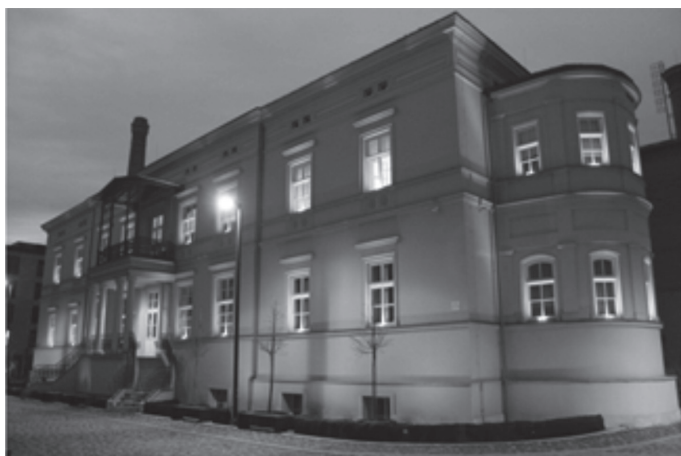
il. 14. Budynek zespołu mieszkaniowego „Browar Lubicz” Pałac Goetzów; widok iluminacji elewacji kamienicy w 2017 r. / housing complex group “Browar Lubicz” Pałac Goetzów view of the facade illumination in the 2017 il. 15. Kamienica przy ul. Radziwiłłowskiej 33; widok iluminacji elewacji kamienicy w 2017 r. / tenement house at Radziwiłłowska 33/35 Street, view of the illumination of the facade of the building in 2017