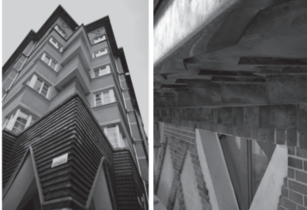
il. 10. Kamienica zlokalizowana przy pl. Inwalidów 6/ ul. Pomorskiej 1/ ul. Sienkiewicza 2-2a / Fig. No. 10 The house located at the pl. Inwalidów 6/ Pomorska 1 Street / Sienkiewicza 2-2a Street il. 11. Kamienica zlokalizowana przy pl. Inwalidów 6/ ul. Pomorskiej 1/ ul. Sienkiewicza 2-2a; detal mosiężnego gzymsu koronującego po przeprowadzonych pracach konserwatorskich w 2014 r.

karskiego znajdują się kryształy mineralne, które intensywnie odbijają światło naturalne. Budynek posiada również szereg elementów wykonanych z metalu. Gzyms koronujący o konstrukcji drewnianej i romboidalnym kształcie został obity blachą miedzianą (il. 11).