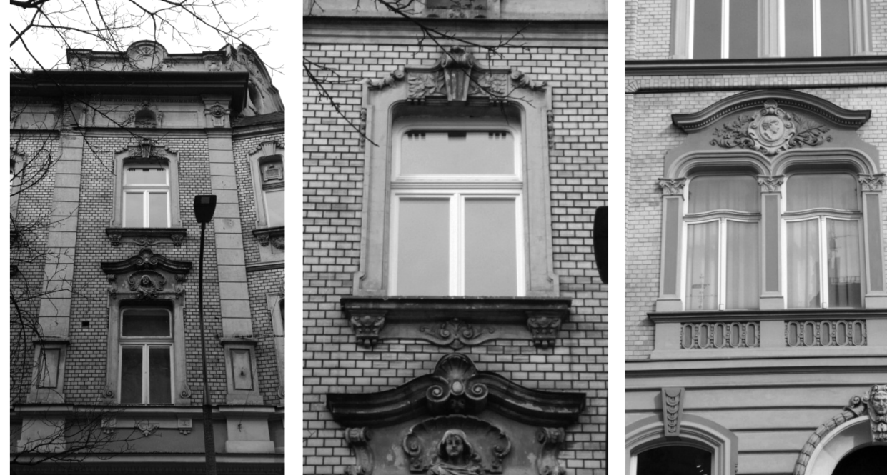
Il. 1 po lewej, il. 2 w środku, stolarka okienna wymieniona na współcześnie wykonane kopie stolarki historycznej w budynku przy ul. Ambrożego Grabowskiego 2/ ul. Karmelickiej 52 oraz il. 3 po prawej, wymieniona współcześnie stolarka okienna w kamienicy przy ul. Karmelickiej 11 ill. 1 on the left, ill. 2 in the middle, window frames listed as the contemporary copies of historical joinery in the building at Ambrożego Grabowskiego 2 Street / Karmelicka 52 Street and ill.. 3 on the right shows the window frames in tenement house at Karmelicka 11 Street

Historical objects have many layers of evidence of their architectural changes, and they often point to functional changes. By converting the buildings, changing the designation, functions, from eg. Sacral to housing, an adaptation of the premises to the requirements was made. Contemporary preservation arrangements are also being made to adapt to the contemporary expectations of the aforementioned space. An example of such arrangement, which was made in the years 2014–2016 is the housing complex “Pod Wawelem”. Design work was done by a Design Office from Cracow. A complex of three buildings linked together made up the complex that, through historical transformations, possessed in its