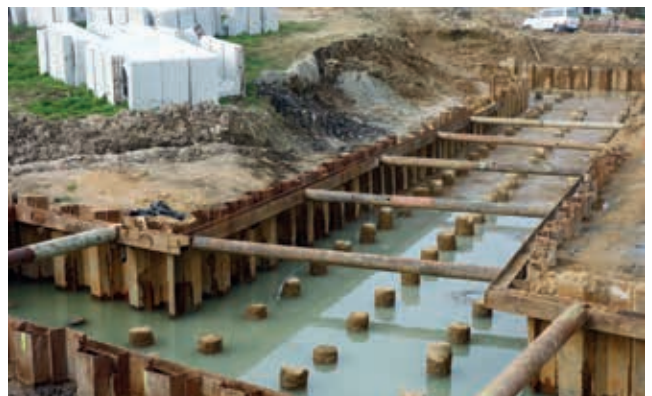
Ryc. 6. Przykładowy sposób wykonania fundamentowania w postaci palowania dla przepustu prefabrykowanego o przekroju skrzynkowym (na dalszym planie widoczne przygotowane prefabrykаты o przekroju dwudzielnym)

Przy projektowaniu fundamentów przepustów należy mieć na uwadze również odpowiednie zaprojektowanie fundamentów