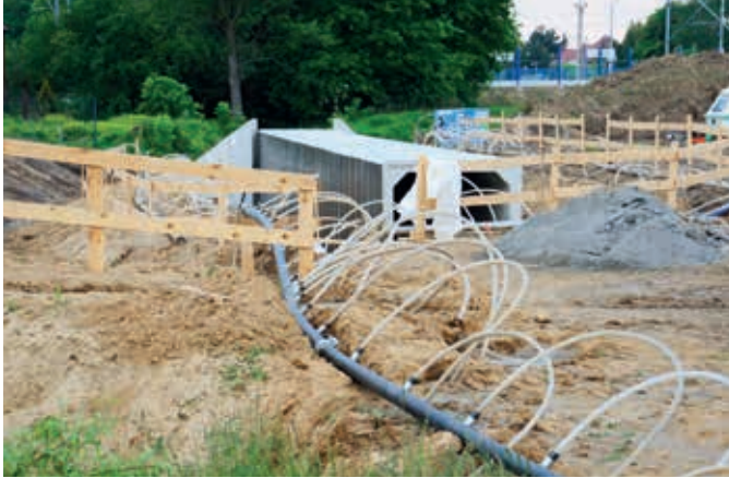
Ryc. 3. Widok przykładowego sposobu odwodnienia terenu budowy przepustu drogowego z wykorzystaniem igłofiltrów