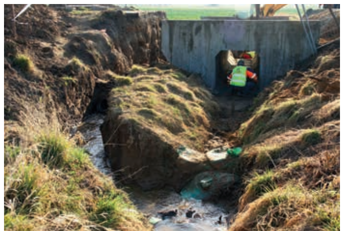
Ryc. 2. Widok przykładowego sposobu przełożenia cieku wodnego za pomocą tymczasowego przepustu o małej średnicy w trakcie realizacji przepustu drogowego o przekroju skrzynkowym

Na zdjęciu fotograficznym zamieszczonym na rycinie 3 przedstawiono przykładowy sposób odwodnienia terenu inwestycji z wykorzystaniem igłofiltrów.