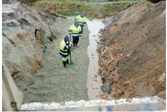
Ryc. 5. Widok przykładowego formowania fundamentu kruszywowego pod przepust skrzynkowy wykonywany metodą półówkową

Warstwa ta powinna być usunięta ręcznie lub mechanicznie z zastosowaniem koparki z oprzyrządowaniem niepowodującym niekorzystnego spulchnienia gruntu.