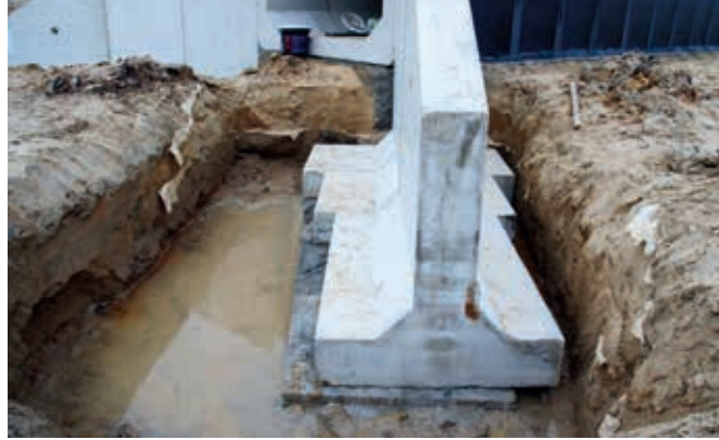
Ryc. 8. Widok przykładowego sposobu wykonania fundamentu płytowego dla skrzydełka prefabrykowanego

pod konstrukcyjne elementy wyposażenia przepustu, tj. głowice i skrzydełka. Fundament pod wymienione elementy powinien spełniać takie same wymagania, jak w przypadku zasadniczej konstrukcji przepustu.