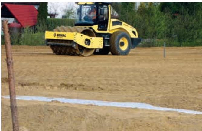
Ryc. 4. Widok przykładowego sposobu wzmocnienia podłoża w obrębie przepustu (w miejscu jego posadowienia) z wykorzystaniem geosyntetyków, fot. A. Wysokowski

Przy mechanicznym wykonywaniu wykopu pod fundament powinna być pozostawiona niepoabrana warstwa gruntu o grubości co najmniej 20,0 cm od projektowanego dna wykopu.