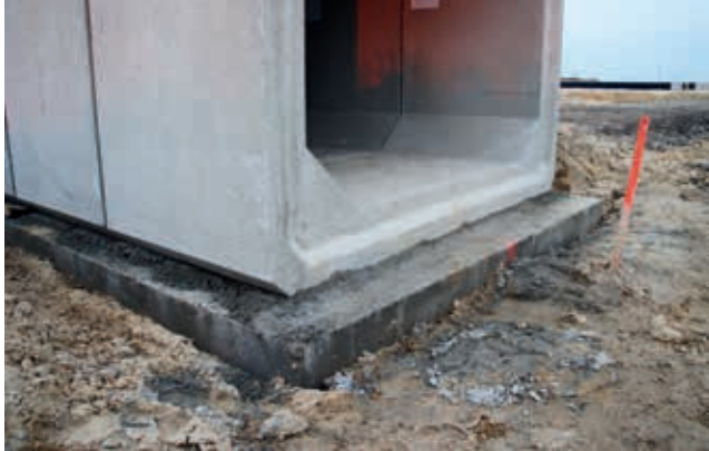
Ryc. 7. Przykład fundamentu w postaci płyty betonowej dla przepustu prefabrykowanego o przekroju skrzynekowym