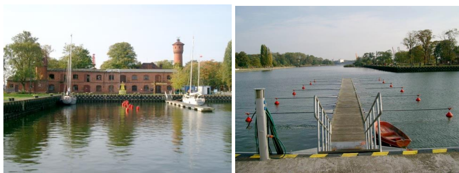
Fot.2. Widok z wody na zabudowania portowe, oraz widok na wodę. Stan z roku 2005 (Institut für Landschaftsplanung Technische Universität Berlin) Photo 2: The view of the port buildings and the view from the side of port buildings of water. State from 2005 (Institute of landscape development, Berlin University of Technology)

townia z wieżą z masywnej czerwonej cegły będąca pod ochroną konserwatora zabytków. Dodatkowo miejsce zajmują budowle nie objęte ochroną konserwatora takie jak zabytkowy żuraw, trzy podzielone arsenały i budynek typu ryglowego. Stan wszystkich obiektów z punktu techniczno-budowlanego jest w większości zły i w obecnym stanie nie nadają się one do użytku. Od roku 1990 kiedy teren ten został opuszczony przez wojska rosyjskie, zabudowania zaczęły ulegać przyspieszonemu niszczeniu. Należały niezwłocznie poddać je pracom remontowym, ponieważ stanowią ważny, interesujący architektonicznie, historycznie i zabytkowo, potencjał powierzchniowy.