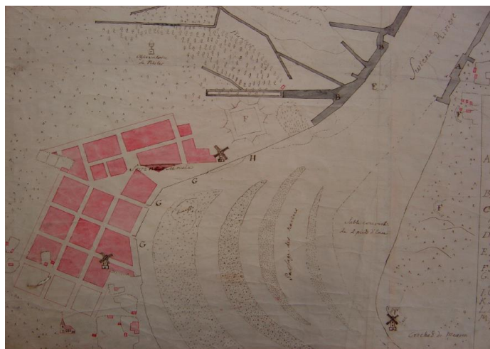
Fot.1. Świnoujście – Plan miasta z 1766r. w zbiorach Stadtbibliothek w Berlinie Photo 1: Świnoujście – city map from 1766 from the collection of Stadtbibliothek in Berlin

Świnoujście to jedna z najpopularniejszych miejscowości nadmorskich w Polsce. Umiejscowiona na dwóch wyspach – Uznam i Wolin stała się jednym z atrakcyjniejszych ośrodków turystycznych. Wyspa Uznam to część miasta wraz z nadbrzeżem promów pasażerskich i białej floty, parkiem zdrojowym, dzielnicą uzdrowską zabudowaną pięknymi XIX-wiecznymi, zabytkowymi kamienicami. Wschodnia część miasta położona na Wolinie to głównie dzielnica przemysłowo-portowo-magazynowa. Gospodarczo miasto zostało więc ukształtowane przez dwie funkcje: portowo-handlową oraz turystyczno-uzdrowską. Historycznie natomiast początki osadnictwa na tym obszarze sięgają okresu IX wieku, a w okolicach ujścia Świny nawet wcześniej. Do 1750 roku Świnoujście było luźno przestrzennie ukształtowaną wioską, dopiero po tej dacie i wykonaniu projektu zagospodarowania miasta w 1765 roku Fryderyk Wilhelm II nadał mu rangę miasta prywatnego, królewskiego [Piskorski 1983, Biranowska-Kurtz 1988].