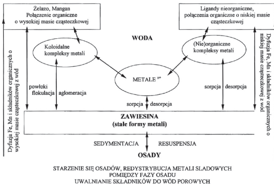
Rys. 2. Główne procesy i mechanizmy reakcji wzajemnego oddziaływania między rozpuszczonymi i stałymi formami metali w wodach

niebezpieczny w badanej matrycy. Takim przykładem jest oznaczanie tri bu tyl o-cyny w wodzie morskiej lub w tkankach lub oznaczanie metylortęci w tkankach.