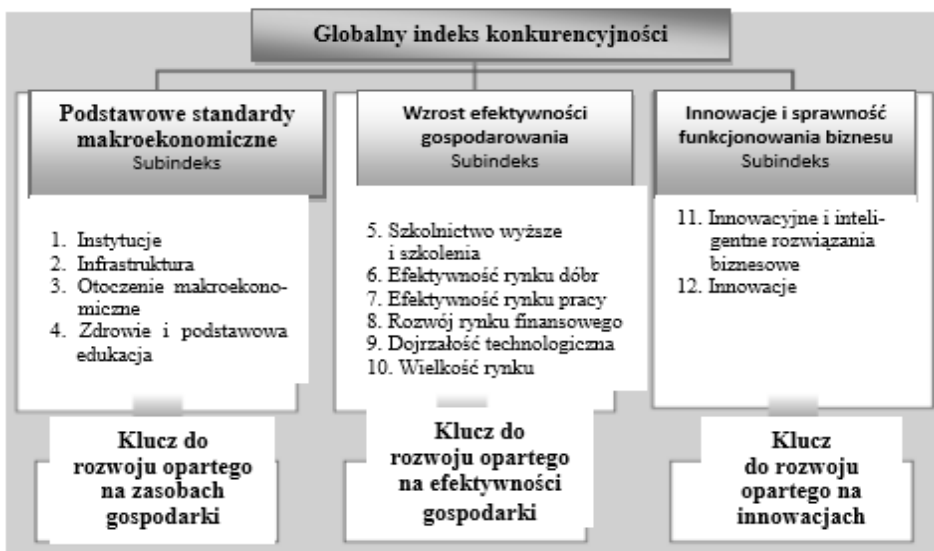
Rysunek 2. Czynniki i kryteria określające globalny wskaźnik konkurencyjności gospodarek.

Wydawany corocznie przez WEF raport na temat konkurencyjności gospodarek jest najbardziej obszernym i wnikliwym tego typu opracowaniem na świecie. Zawiera szczegółową charakterystykę każdego kraju (jego profil) wraz z rozbudowanym zestawem danych statystycznych oraz globalnym rankingiem poszczególnych gospodarek, obejmującym aż 114 wskaźników. Konkurencyjność definiowana jest jako zewnętrzny efekt wspólnego działania zbioru instytucjonalnych, politycznych i ekonomicznych (produktywność) czynników. Przyjmuje się, że wyznacza ją zestaw 12 głównych czynników (filary konkurencyjności). Wśród nich ważne, drugie miejsce zajmuje infrastruktura stanowiąca podstawę krajowych przemysłów sieciowych (por. rys. 2).