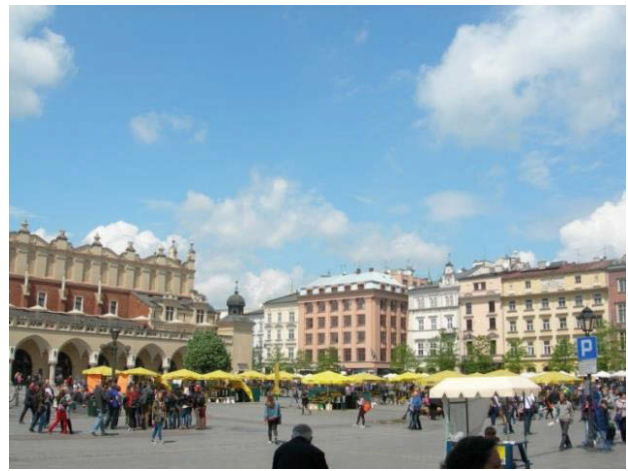
Il. 5. Budynek Wiedeńskiego Towarzystwa Ubezpieczeniowego „Feniks”, Rynek Główny w Krakowie, Polska, autor: A. Szyszko-Bohusz, stan obecny.