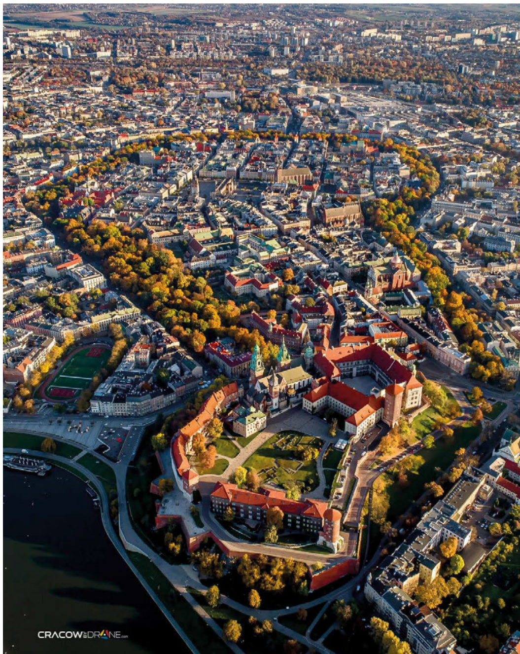
Il 1. Kraków — widok historycznego centrum z lotu ptaka.