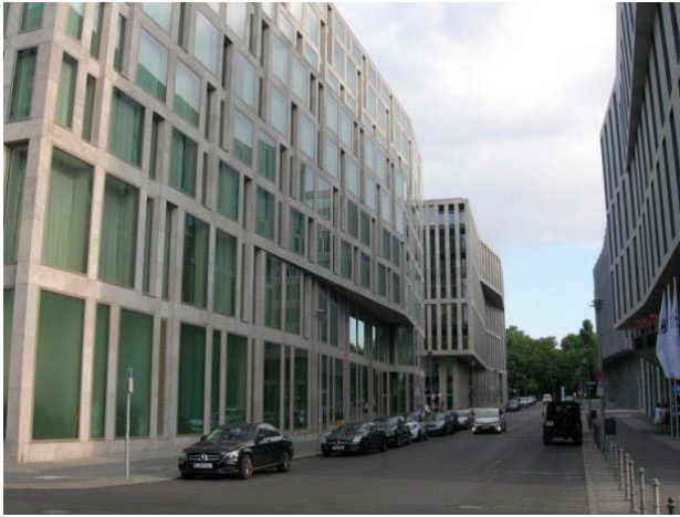
Il. 8. Zabudowa okolic Hauptbahnhof w Berlinie.