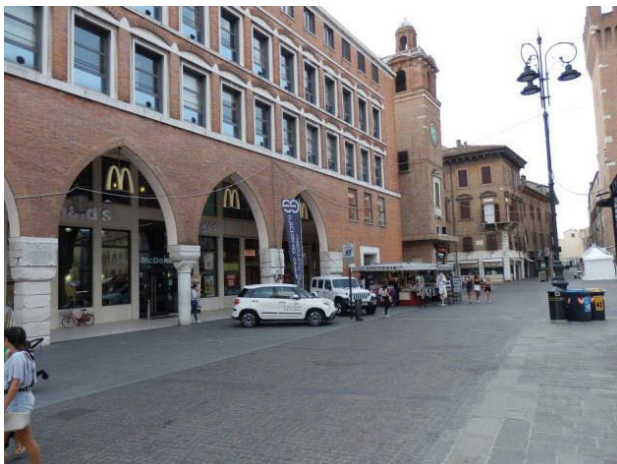
Il. 6. Restauracja McDonald’s w zabytkowej pierzei Piazza Trento e Trieste, Ferrara, Włochy (fot. J. Barnaś).