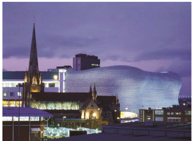
Il. 7. Dom Handlowy Selfridges, Birmingham, Wielka Brytania, projekt: Future Systems, Jan Kaplický i Amanda Levete.