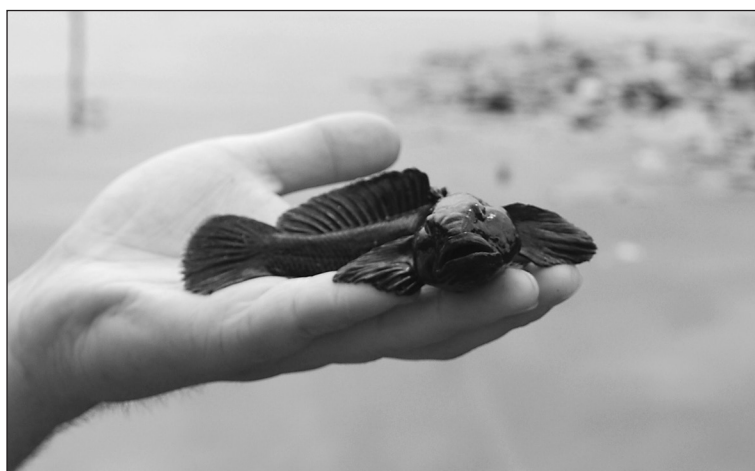
Fot. 1. Babka bycza

Postanowiono zatem dokonać pomiarów morfometrycznych oraz ocenić stopień dojrzałości gonad babki byczej stanowiącej przyłów podczas połowów gospodarczych prowadzonych w 2010 roku w jeziorze Dąbie (w celu określenia ich kondycji oraz stopnia przygotowania ryb do odbycia tarła).