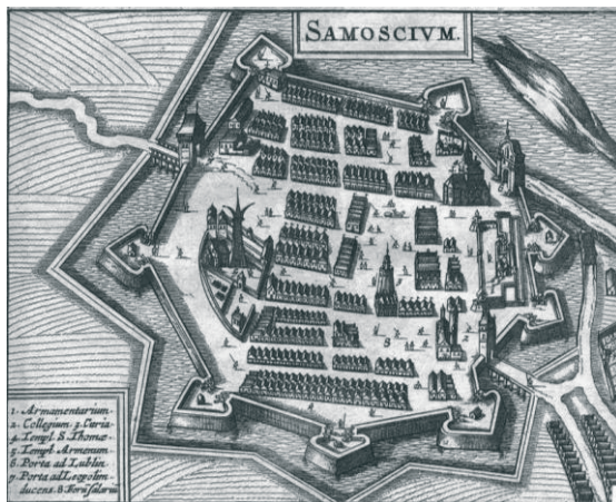
Rys. 1. Archiwalny plan Zamościa.

Zamość, spełnione marzenie hetmana Jana Zamoyskiego (1542-1605) i zrealizowane miasto idealne 3 , położone w południowej części województwa lubelskiego, jest obecnie jedną z 16 dzielnic miasta o tej samej nazwie. Początki ośrodka sięgają roku 1579, kiedy to rozpoczęła się budowa miasta; rok później Zamość otrzymał prawa miejskie. W 1589 roku został stolicą Ordynacji Zamojskiej. Pierwotnie miasto nosiło nazwę Nowy Zamość, w celu odróżnienia od starej osady Zamość, mieszczącej się na północ od nowopowstałego ośrodka. Wkrótce jednak osada przyjęła nazwę „Stary Zamość”, a Zamościem zostało nowe miasto. Powstanie Zamościa było sprawą bezprecedensową. Zbudowanie prywatnego miasta, w dodatku na surowym korzeniu, wiązało się z ogromnym ryzykiem i jeszcze większymi kosztami. Przedsięwzięcie Zamoyskiego i Morando okazało się jednak sukcesem, a już na przełomie XVI i XVII wieku Zamość był ważnym centrum naukowym i kulturalnym.