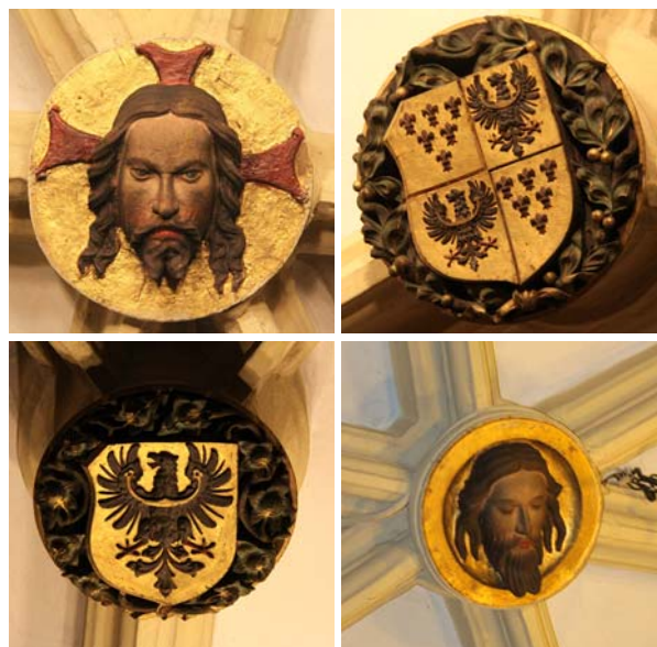
Ryc. 10. Neogotyckie zworniki w kapitularzu Fig. 10. Neo-gothic keystones in the capitulary

Faza 5. Po połowie XIX w. kwadratowa sień na parterze i pomieszczenie piwniczne w jej pionie zostały