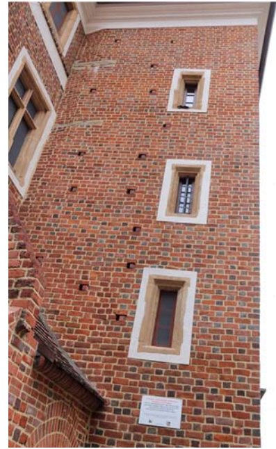
Ryc. 2. Dom Kapituły Katedralnej, wieżowy aneks południowy: A – stan sprzed konserwacji, fot. M. Chorowska, B – elewacja zach. aneksu wykonana metodą ortofoto, oprac. Laboratorium Skanowania i Modelowania 3D Politechniki Wrocławskiej, C – stan po konserwacji, fot. M. Chorowska. Za hipotezą mówiącą o równoczesnej budowie wieży pld. z domem głównym przemawia zastosowanie w licu aneksu wieżowego zendrówek w regularnym wątku kowadełkowym, identycznym, jak na pozostałych elewacjach domu. Obraz C pokazuje odchylenie aneksu od pionu