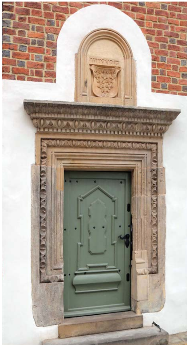
Ryc. 7. Wczesnorenansansowy portal z 1527 r. w wieżowym aneksie południowym przy dawnym Domu Kapituły Katedralnej Fig. 7. Early-renaissance portal from 1527 in the tower annex at the former Cathedral Chapter House