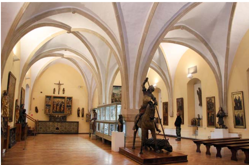
Ryc. 3. Sala dawnej biblioteki na I piętrze Domu Kapituły Katedralnej zamieniona na salę ekspozycyjną Muzeum Archidiecezjalnego, w widoku od północy

original fragments of the outer walls are preserved there is a neatly worked out monk bond. In Wrocław area such regularity in placing burrs is characteristic only of the cathedral construction workshop.