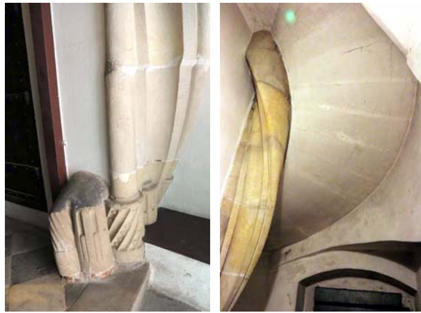
Ryc. 6. Kamienne schody kręte w wieżowym aneksie południowym przy dawnym Domu Kapituły Katedralnej. Widok na relikty cokolików słuzek i podniebienie schodów Fig. 6. Winding stone stairs in the southern tower annex at the former house of the Cathedral Chapter. The view of the relics of ancillary column plinths and stair rise