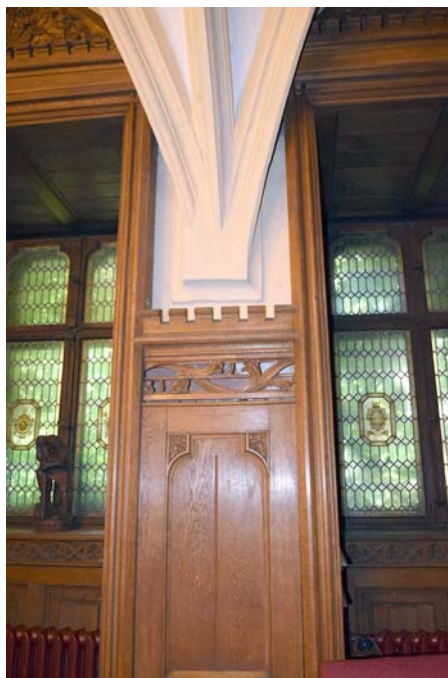
Ryc. 9. Zbliżenia elementów neogotyckiego wystroju i wyposażenia kapitułarza

The time of those changes is defined by the date 1527 written by means of Roman numbers (M D XX VII) over the escutcheon of Wrocław bishopric (diocese), placed above the main portal cornice. The reconstruction of the break took place almost 10 years later than the realization of the library. The accumulation of large, richly ornamented portals together with a spectacular form of stair stem enwrapped with braided ancillary columns shows that this entrance was a ceremonial one. On the first floor, on the level of the entrance to the library, the stair treads made a small landing and then they continued to climb