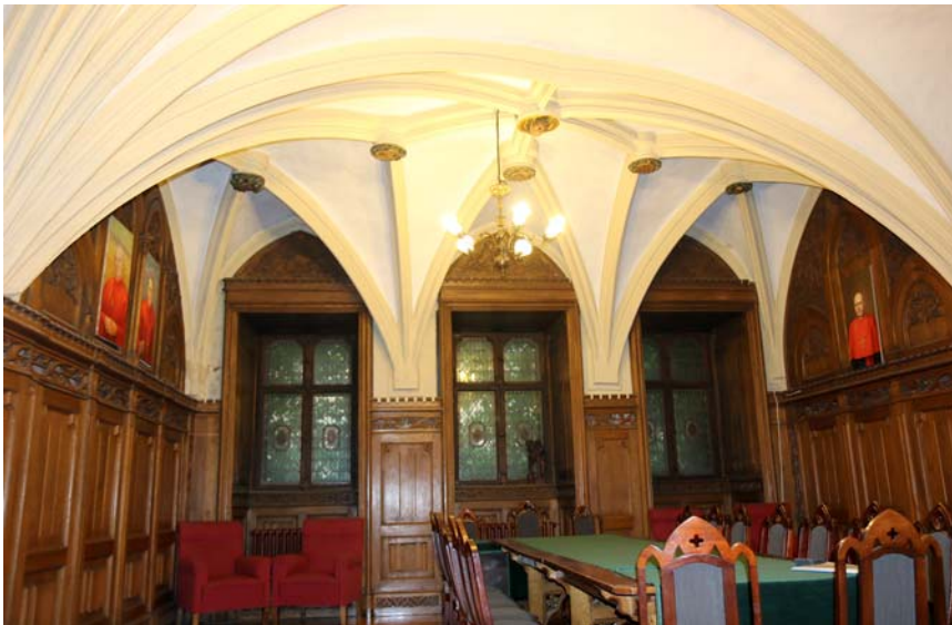
Ryc. 8. Wnętrze kapitułarza w dawnym Domu Kapituły Katedralnej po renowacji z 1882 r., stan obecny