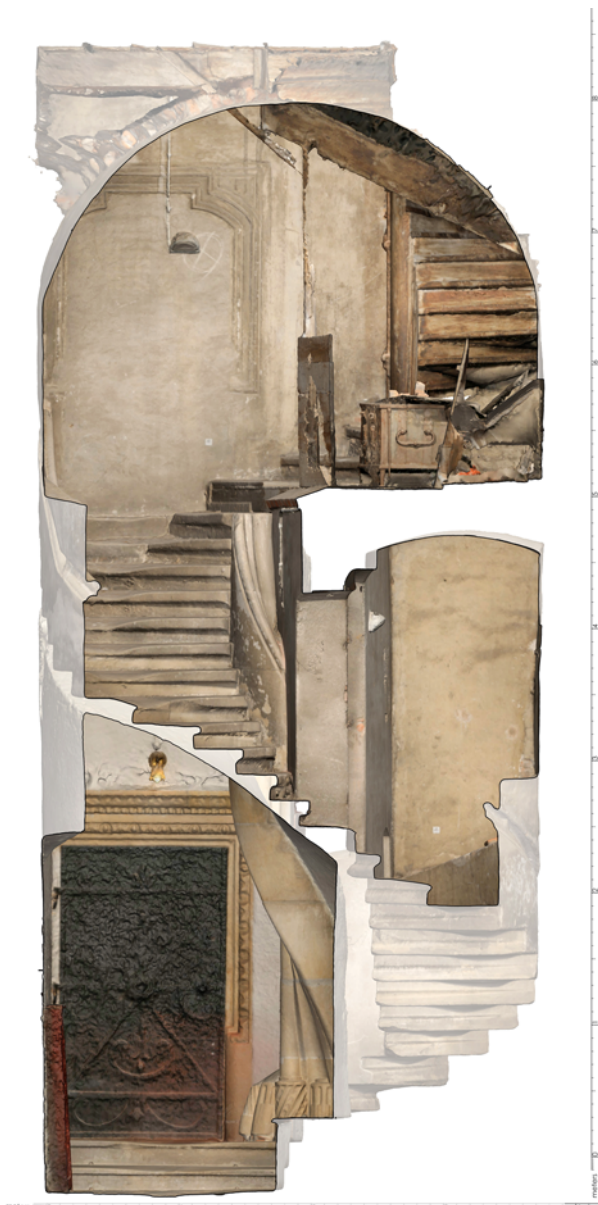
Ryc. 5. Inwentaryzacja kamiennych schodów krętych w wieżowym aneksie południowym wykonana metodą fotoskanowania, oprac. M. Caban Fig. 5. Cataloguing of winding stone stairs in the southern tower stair annex made by the use of photo-scanning, developed by M. Caban