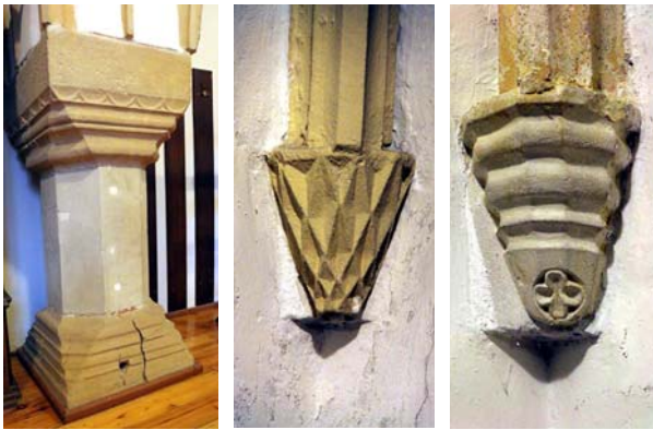
Ryc. 4. Detale kamieniarskie dawnej sieni na parterze Domu Kapituły Katedralnej – filar i wsporniki sklepienne, fot. M. Chorowska Fig. 4. Stonework details of the former hallway on the ground floor of the Cathedral Chapter House – pillar and vaulted cantilevers, photo: M. Chorowska