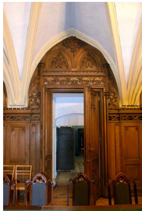
Fig. 9. Close-ups of neo-gothic elements of décor and furnishings of the capitulary