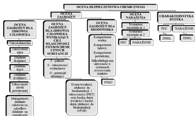
Rys. 1. Schemat oceny bezpieczeństwa chemicznego, gdzie: PNEC – przewidywane stężenie niepowodujące niekorzystnych skutków dla środowiska, PEC – przewidywane stężenie w środowisku, DNEL – pochodna poziomów niepowodująca zmian wg [1, 3, 4]

Ocena bezpieczeństwa chemicznego sporządzona przez producenta dotyczy przede wszystkim procesu produkcji substancji i wszelkich jej zastosowań. Natomiast ocena ta sporządzona przez importera dotyczy jedynie wszelkich zastosowań danej substancji chemicznej. Jest ona oparta na porównaniu potencjalnych szkodliwych skutków działania substancji ze znanym i racjonalnie przewidywalnym narażeniem człowieka lub środowiska na działanie tej substancji [2]. Na Rysunku 1 przedstawiono schemat oceny bezpieczeństwa chemicznego, który składa się z oceny zagrożeń, oceny narażenia oraz charakterystyki ryzyka.