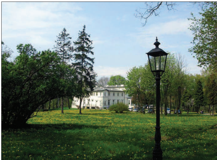
Fot. 4. Dwór w Rozdźałach – obecnie hospicjum, fot. A. Krajewska , maj 2014 r.