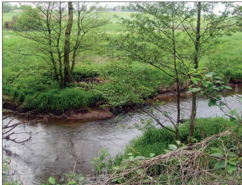
Fot. 3. Widok ze skarpy na meandrującą Swednię w Nędzerczewie, maj 2014 r.