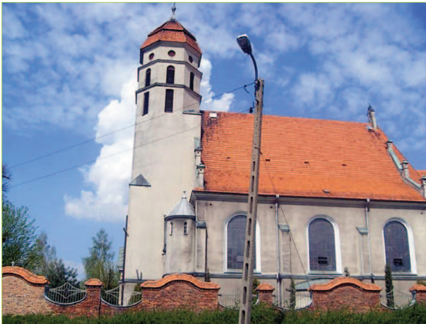
Fot. 10. Kościół pw. Zwiastowania NMP w Dębem, maj 2014 r.