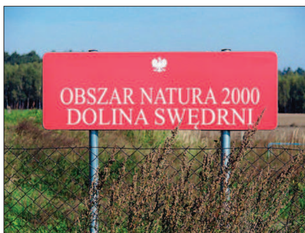
Fot. 1. Tablica informacyjna, fot. A. Krajewska, maj 2014 r.