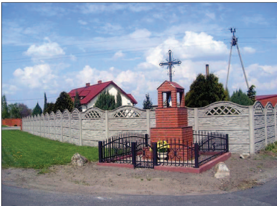
Fot. 11. Kapliczka przydrożna na skrzyżowaniu dróg w Rożdżalach, fot. A. Krajewska, maj 2014 r.