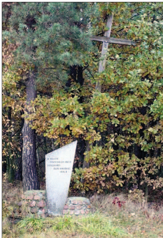
Fot. 8. Krzyż z tablicą upamiętniającą miejsce śmierci powstańców styczniowych niedaleko Kamienia, fot. A. Krajewska, maj 2014r.