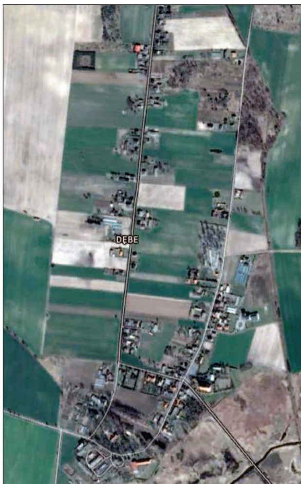
Fot. 12. Układ osadniczy wsi Dębe