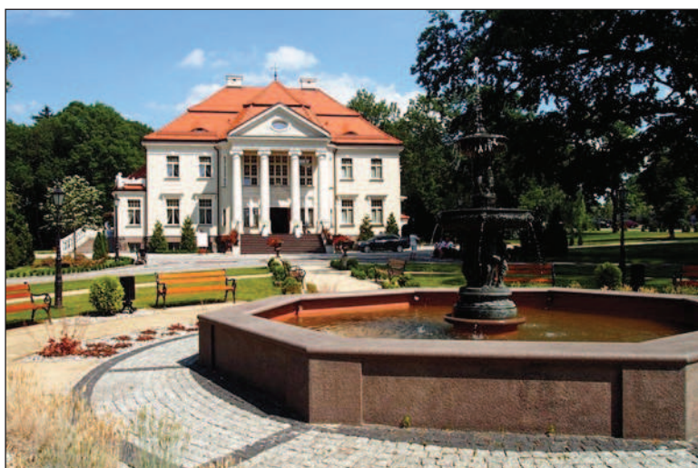
Fot. 9. Pałac w Tłokini Kościelnej, fot. A. Krajewska, maj 2014 r.