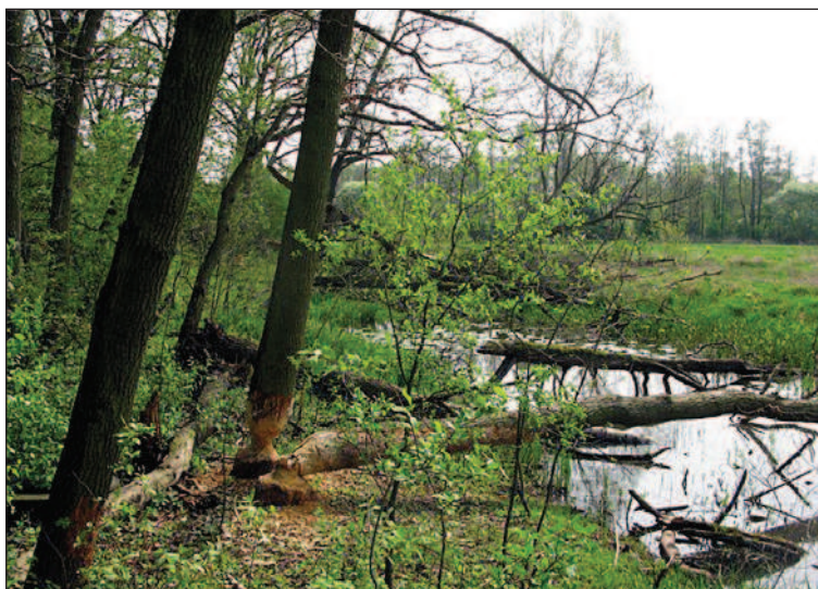
Fot. 6. Starorzecze Swędrni z widocznymi skutkami działalności bobrów europejskich, fot. A. Krajewska, maj 2014 r.

Mając za plecami skaręgę z dębami, widzimy malownicze starorzecze, na którym swoją działalność zaznaczył bóbr europejski, a na dalszym planie - półkole utworzone przez ścianę lasu i nadrzeczne łąki. Jednocześnie wsłuchujemy się tu w różnorodne odgłosy ptaków.