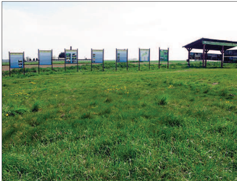
Fot. 2. Wiata i tablice edukacyjne w Nędzerczewie, maj 2014 r.