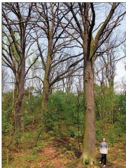
Fot. 5. Pomnik przyrody: Grupa Drzew