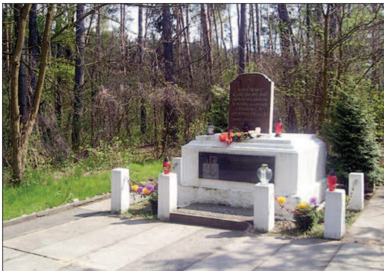
Fot. 7. Nagrobek upamiętniający miejsce stracenia 56 żołnierzy Armii Krajowej w Lesie Skarszewskim, maj 2014 r.