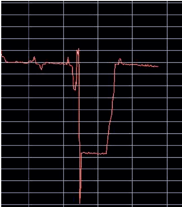
Rys. 3. Przykładowy przebieg różnicy ciśnień podczas badania szczelności.

Podczas badań komory spalania zmieniano szczelność komory poprzez montaż pierścieni znajdujących się w różnym stanie technicznym. Po wymianie pierścienia pojawiała się różnica ciśnienia na manometrze różnicowym, rys. 3. Za pomocą zaworu dławiącego doprowadzano do „wyzeroowania manometru różnicowego”, rys.3. Odczytywano liczbę działek na bębnie zaworu.