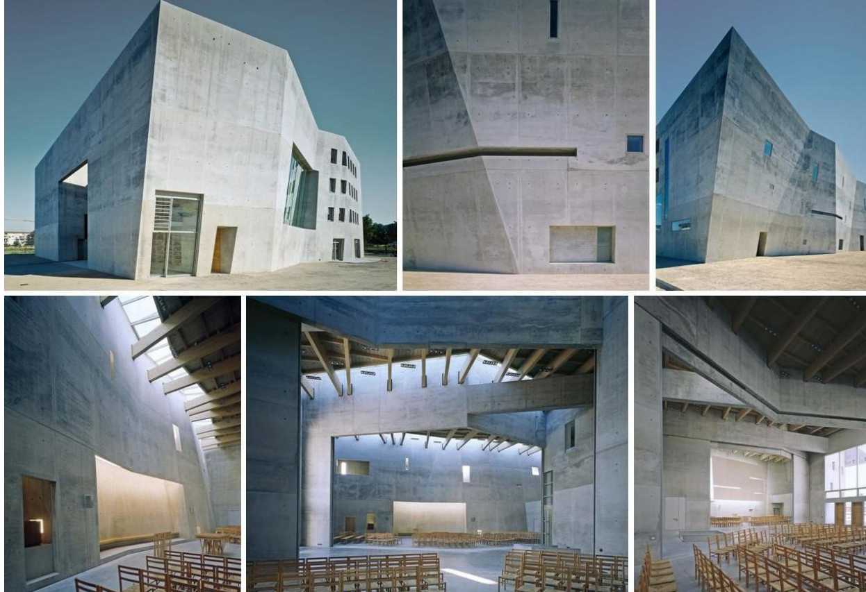
Il. 2. Kościół Świętej Marii Magdaleny, Freiburg im Breisgau, Niemcy, projekt: KSG Architekten