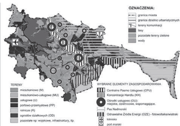
Rys. 4. Bieguny wzrostu Gdańska