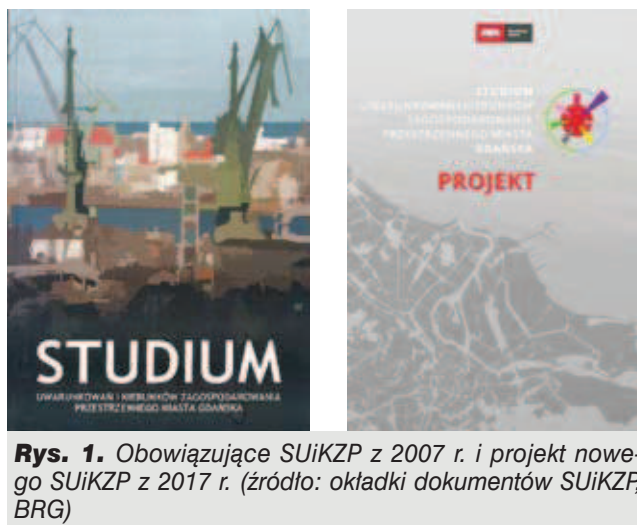
Rys. 1. Obowiązujące SUIKZP z 2007 r. i projekt nowego SUIKZP z 2017 r.

Ostatnie lata były okresem bardzo intensywnego rozwoju Gdańska i znaczących zmian przestrzennych: powstały od dawna oczekiwane i zaplanowane inwestycje komunikacyjne, rozwinęły się główne funkcje miastotwórcze, powstało wiele nowych miejsc pracy, poprawiła się jakość życia mieszkańców, wzrosła atrakcyjność zamieszkiwania w Gdańsku, co m.in. zahamowało odpływ ludności. Obowiązujący w dalszym ciągu dokument stworzył sprzyjające warunki do rozwoju przestrzennego w duchu zasad rozwoju zrównoważonego, akcentując rozwój miasta do wewnątrz, zapewniając m.in. ochronę wartości przyrodniczych i kulturowych. Zabezpieczył przestrzeń dla rozwoju węzłowych gałęzi gospodarki: morskiej, turystycznej i sektora opartego na wiedzy. Jak widać, dokument sprzed 10 lat trafnie przewidywał generalne kierunki rozwoju miasta. Jednak w tym