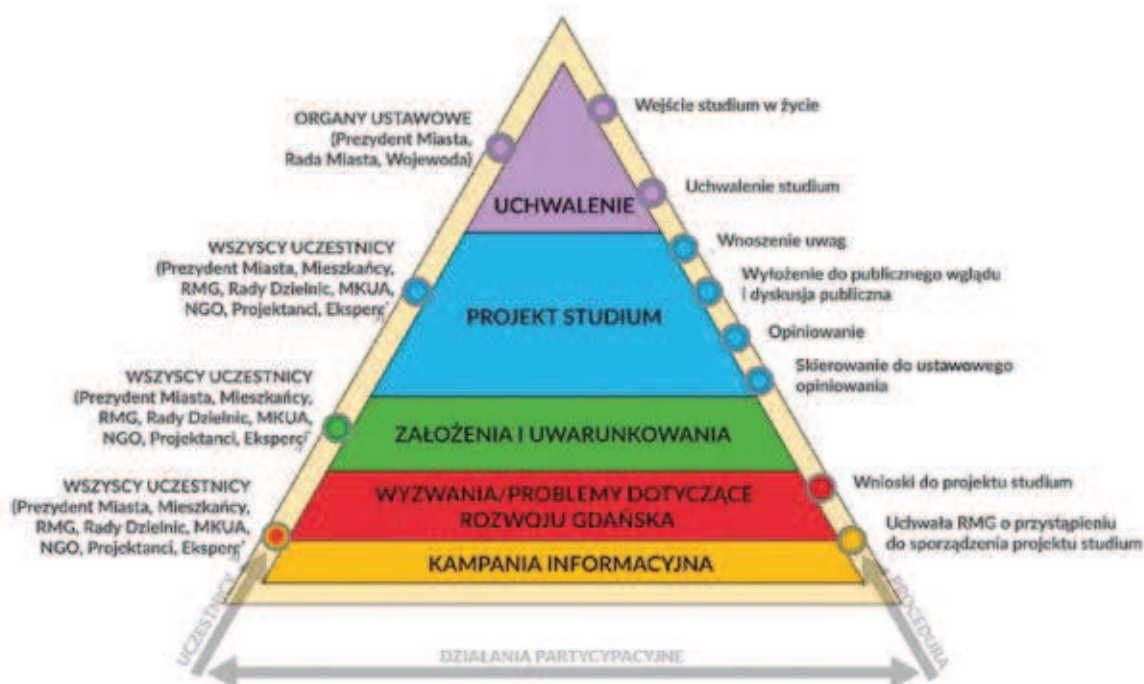
Rys. 2. Gdański model partycypacji społecznej

łałość zapewniającą powstawanie nowych miejsc pracy i czy przewidziano tereny pod nowe parki, nowe linie tramwajowe, drogi? Na te pytania i na wiele innych znajdziemy odpowiedź w studium.