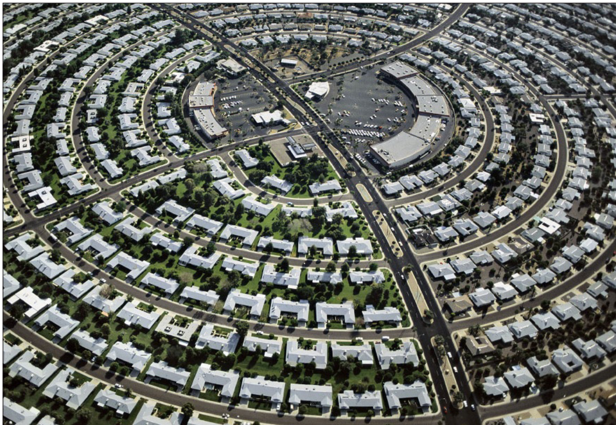
Ryc. 1. Miasto seniorów – Sun City Arizona.