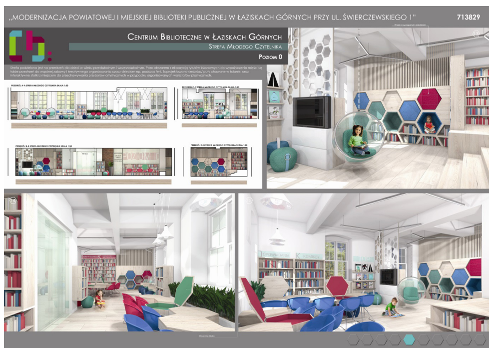
Fot. 1 Plansza 1 – Strefa Młodego Czytelnika, oprac. Autor

Część dziecięco – młodzieżowa – jest strefą biblioteki, która udostępnia najmłodszym użytkownikom w mieście wszystko to, co jest niezbędne do nauki oraz rozwoju, w tym także rozrywkę. Stanowi zaplecze ich codziennego życia, wypełniając równocześnie im wolny czas na co dzień, a także w okresach przerw w nauce. Zajmuje się również organizowaniem wszelkich zajęć dla maluchów i młodzieży, zarówno w charakterze nauki w szkole, jak i w celu rozwoju ich umiejętności poprzez rozrywkę (fot. 1).