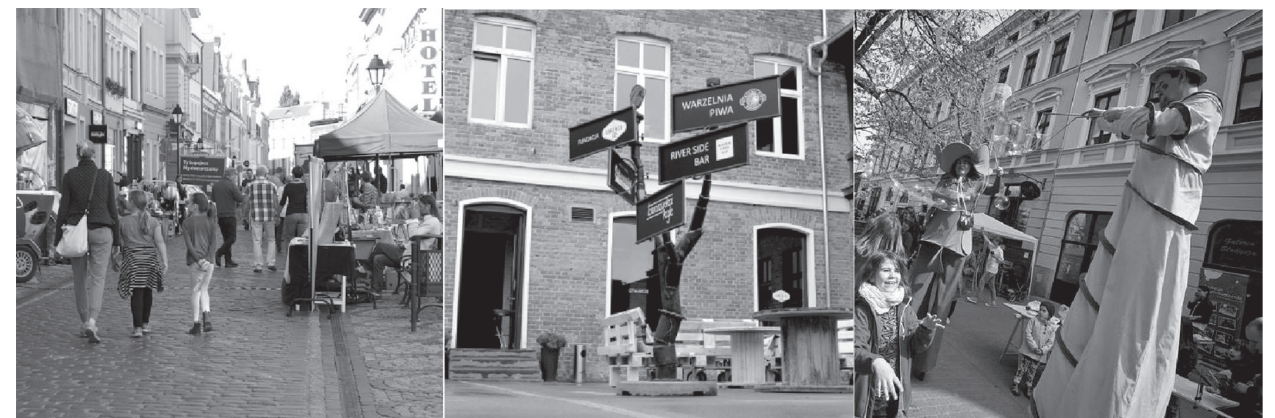
il. 1. Lokalne społeczności aktywne w wybranych lokalizacjach / Local societies being active in chosen places Fot. a. Ulica Długa, Fot. b. Kamienica 12 , Fot. c. Ulica Gimnazjalna fot. Autorka / Photo a. Długa Street, photo b. Kamienica 12 , Phptp c. Gimnazjalna Street, photo by the author

Długa Street is a main historical high road of the Old Town, previously limited with city gates: Kuyavian and Pomeranian, with a preserved 18 th and 19 th century architecture with previous relicts. Social activity around this space focuses around two entities: Local Organization of Bydgoszcz BYLOT and Society Bydgoska Starówka . Local Tourism Organization of Bydgoszcz BYLOT 15 was created in 2006. The organization bases its activities on consolidation of various societies e.g. entrepreneurs, cultural institutions, restaurant owners, hoteliers and local government in order to cooperate for social-economic development of the city and the region. BYLOT attempts to organize public events, that aim for building citizens' identity and promot-