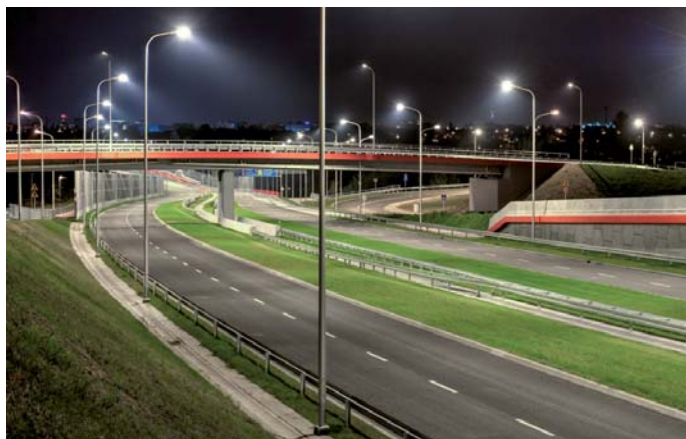
Fot. 1. Aleja Solidarności – pod wiaduktem