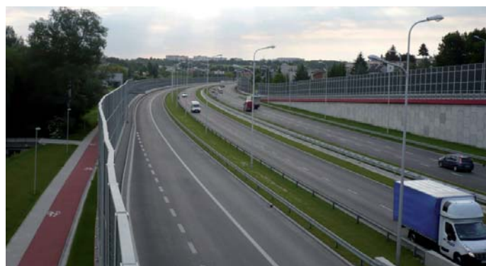
Fot. 6. Aleja Solidarności – widok z wiaduktu