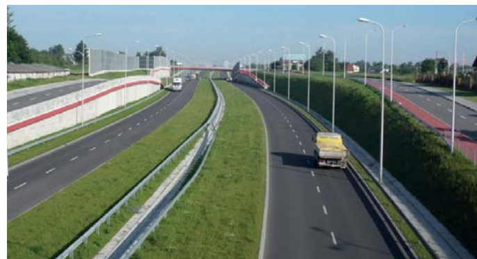
Fot. 5. Aleja Solidarności – na łuku