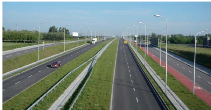
Fot. 4. Aleja Solidarności – na prostej

Poniżej przedstawiamy galerię fotografii z realizacji drogowych, głównie małej obwodnicy.