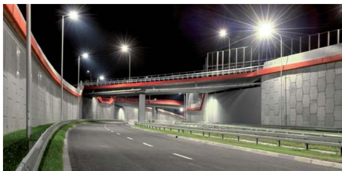
Fot. 2. Aleja Solidarności – w murach oporowych