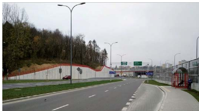
Fot. 7. Ulica Duchą