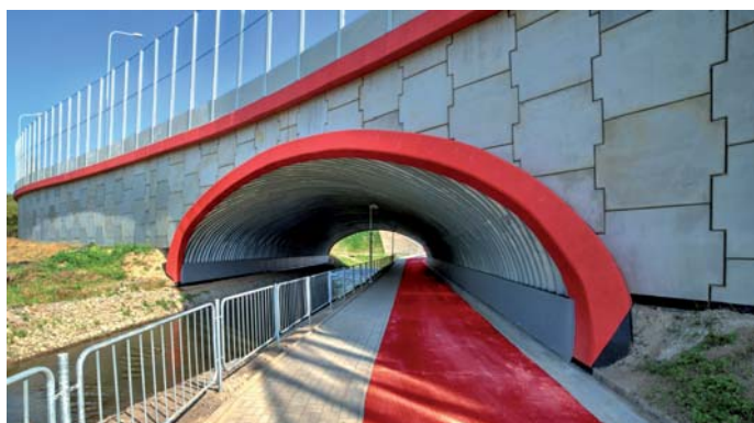
Fot. 3. Aleja Solidarności – przepust z rzeką, chodnikiem i ścieżka rowerową