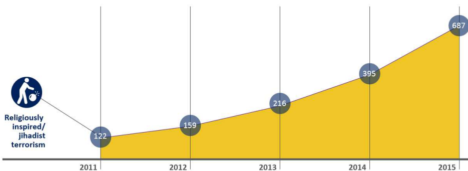
Rys.2 Liczba osób aresztowanych pod zarzutem terroryzmu inspirowanego religijnie/związanego z dżihadem w latach 2011-2015

źródło: European Union Terrorism Situation and Trend Report (TE-SAT) 2016, European Police Office, 2016, s. 23 (dostęp: 03.09.2016)