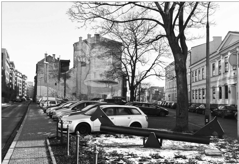
Ryc.1. Mural Ding Dong Dumb w przestrzeni ulicy. Na pierwszym planie pomnik Gombrowiczowi – Polacy

na temat powierzchowności katolicyzmu w Polsce 4 . Dlatego Ding Dong Dumb to obraz mogący wywoływać emocje, szczególnie wśród osób o wyznaniu chrześcijańskim.