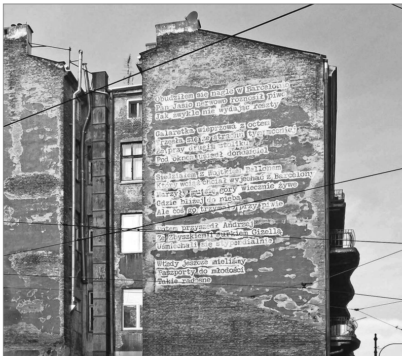
Ryc.7. Mural Barcelona

cych kamienic pozostały ślady po przylegającym dawniej budynku. To właśnie na ich murach artysta umieścił wiersz Adama Ziemiańskiego pt. Barcelona i reprodukcję fotografii (Jakubowski 2015) z wnętrza baru pochodząca z 1914 r.