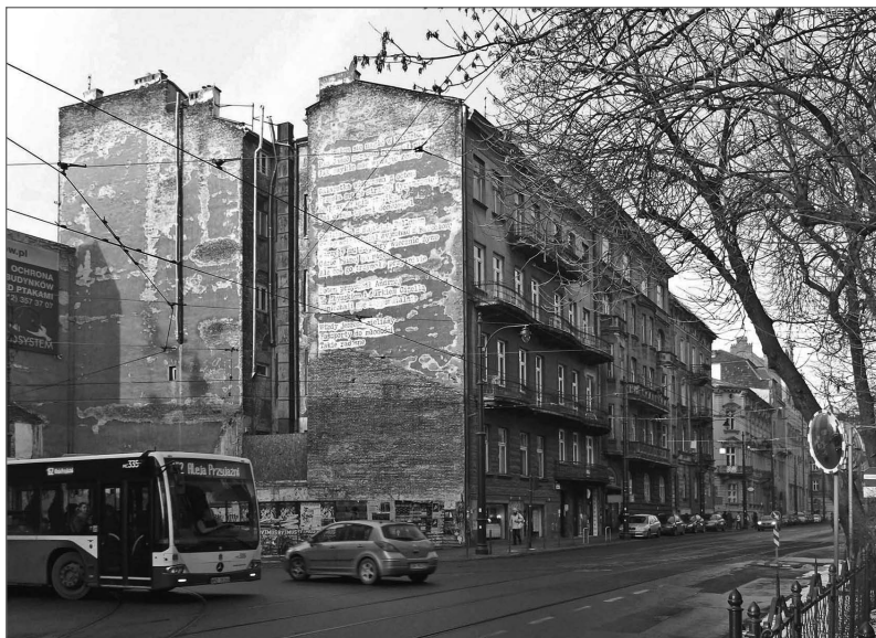
Ryc. 6. Mural Barcelona w przestrzeni ulicy

ona rozbudowywana przez dwóch kolejnych posiadaczy, by zyskać ostateczny kształt w roku 1845. Ponad 40 lat później w części lokalu urządzono szynk. Pomimo iż zmieniający się najemcy pragnęli w miejscu kameralnej piwiarni umieścić nowy, reprezentacyjny budynek – zachowała się ona aż do czasów powojennych, by w 1951 r. jako nieruchomość upaństwowiona stać się Jadłodajnią Uniwersytecką – zwaną potocznie „Barceloną”.