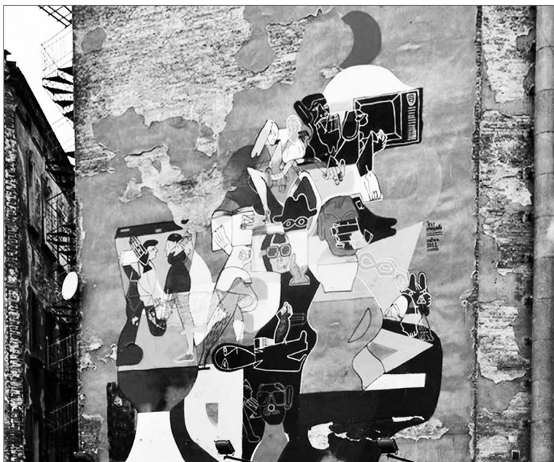
Ryc. 8. Fragment muralu Jest spokojnie

O tym manifestie młodzieży starał się przypomnieć ZBIOK w muralu pt. Jest spokojnie... , który do sierpnia 2015 r. zdobił boczną elewację szczytową kamienicy przy ul. Karmelickiej (ryc. 8). Żywa, barwna płatanina postaci o syntetycznych formach przywołała na myśl twórczość Fernanda Légera. Interesująca była również kompozycja muralu – artysta dopasował ją do ściany, wprowadzając malowidło tylko w miejscach, gdzie tynk nie był zniszczony, a więc u podnóża budynku. Dało to efekt syntezy tkanki malarskiej i architektonicznej. Dzięki wibrującym barwom, ogromnym gabarytom i dynamicznej kompozycji mural pełnił funkcję akcentu w przestrzeni ulicy. Ściana szczytowa, na której był zlokalizowany, przylega do publicznego parkingu, dzięki czemu dzieło zyskiwało widokowe przedpole. Z pewnością malowidło wzbogacało krajobraz ulicy, a dzięki humorystycznemu przesłaniu wzbudzało pozytywne