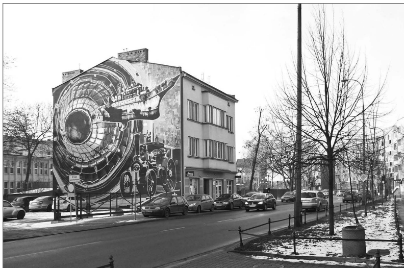
Ryc. 5. Mural AGH

W Krakowie napotkać można bardzo wiele ulic z monotonną zabudową, gdzie obserwator prędko traci orientację i nie koncentruje się na otaczającej przestrzeni. Jako przykład można tu podać trakty położone w dzielnicach z wielkimi osiedlami mieszkaniowymi, takimi jak Ruczaj czy Piaski Wielkie. Wprowadzenie tam punktów orientacyjnych w postaci elementów streetartowych może stać się nie tylko drogowszkazem i miłym dla oka akcentem w przestrzeni ulicy, lecz spowodować zainteresowanie turystyczne danym miejscem w ramach Krakowskiego Szlaku Street Artu, a co za tym idzie – przyczynić się do jego dalszego rozwoju i potencjalnej rewitalizacji.