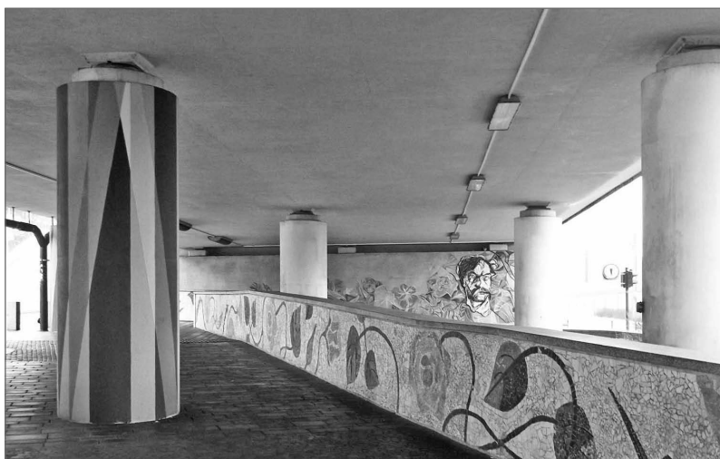
Ryc. 3. Mozaika Wyspiański na Mogiłskim

Dzięki zezwoleniu Rady Miasta Krakowa i współpracy artystów z mieszkańcami rozpoczęto przekształcanie dolnego poziomu ronda w „zewnątrzną galerię sztuki ulicznej” 6 . Pierwszym etapem była podejmowana dwukrotnie akcja „Wyspiański na Mogiłskim” (2012 i 2013), w trakcie której wykonano największą w Polsce mozaikę inspirowaną twórczością Stanisława Wyspiańskiego (motywy roślinne, podobizna artysty – ryc. 3) zaprojektowaną przez Lubosza Karwata 7 .