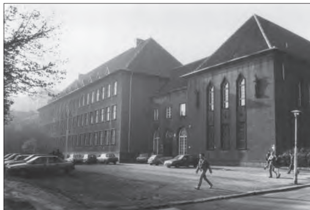
Fot. 6. Gmach Wydziału Elektrycznego Politechniki Śląskiej (źródło: strona internetowa Katedry Elektroniki, Elektrotechniki i Mikroelektroniki Politechniki Śląskiej, https://www.polsl.pl/rau11/historia-katedry/historia/katedra-radio-techniki/ [dostęp 10.11.2022])