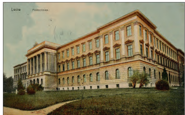
Fot. 2. Gmach główny Politechniki Lwowskiej na pocztówce z 1911 roku