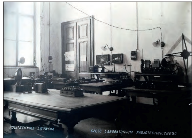
Fot. 4. Fragment laboratorium radiotechnicznego Politechniki Lwowskiej