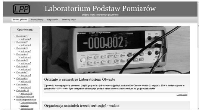
Rys. 1. Portal internetowy Laboratorium Podstaw Pomiarów

Na potrzeby obsługi laboratorium utworzono portal Laboratorium Podstaw Pomiarów ( www.pom.ise.pw.edu.pl ). Dostępne są na nim instrukcje do ćwiczeń możliwe do pobierania w formacie pdf, materiały pomocnicze, programy demonstracyjne a także szablony protokołów do poszczególnych ćwiczeń. Portal stanowi też główną platformę przekazywania studentom informacji dotyczących bieżącego funkcjonowania laboratorium.