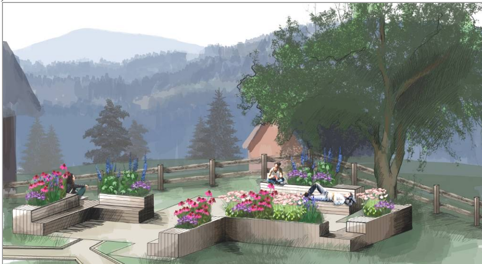
Ryc. 3. Idea projektowa. Rzut (A) i wizualizacje (B, C) (oprac. własne)