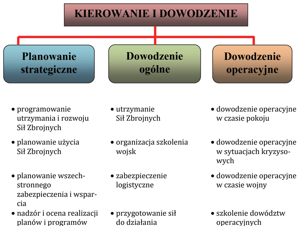
Rys. 2. Podstawowe funkcje kierowania i dowodzenia