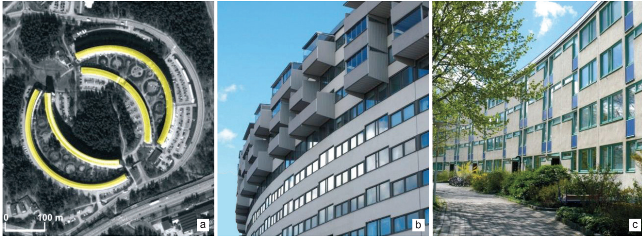
Il. 3. Täby, zespół Grindtorp: a) plan sytuacyjny (opracowanie własne na podstawie Google Maps; data dostępu: 20.08.2014); b) fragment elewacji północnej jednego z wyższych budynków; c) kompozycja otworów okiennych na elewacji północnej jednego z niższych budynków