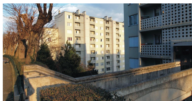
Il. 2. Saint-Étienne, osiedle Beaulieu – Le Rond-Point

Täby to miasto satelitarne Sztokholmu, które zachowało niezależność administracyjną. Położone jest w odległości około 17 km na północ od centrum stolicy Szwecji. Współcześnie obejmuje powierzchnię 61 km 2 i zamieszkiwane jest przez 67 tysięcy osób 8 . Täby doświadczyło gwałtownego rozwoju struktury miejskiej w latach 60. i 70. XX w. Wiązało się to z zapoczątkowaną w latach 40. XX w. realizacją planu deglomeracji Sztokholmu i budowy nowych jednostek satelitarnych. Podobnie jak ośrodki kształtowane według koncepcji ABC powstało wzdłuż linii kolejowej prowadzącej do stolicy, a lokalizacja dworca stała się załóżkiem nowego centrum miasta. Jednak struktura ośrodka, ze względu na brak zaplecza zapewniającego zatrudnienie mieszkańcom, nie w pełni