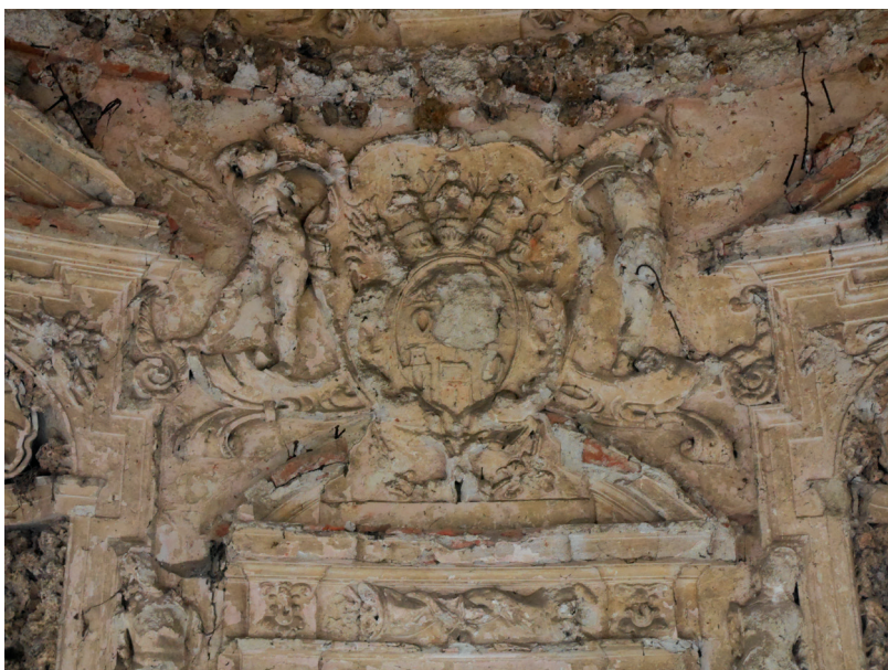
Herb rodziny Herbersteinów z wnętrza grotty w Gorzanowie Coat of arms of Herberstein family from the Gorzanów grotto interior