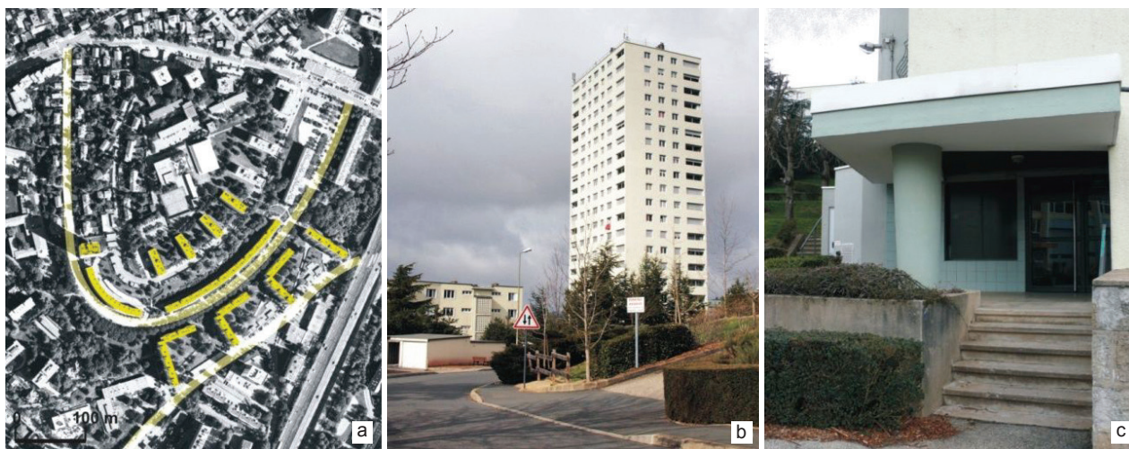
Il. 1. Saint-Étienne, osiedle Beaulieu – Le Rond-Point: a) plan sytuacyjny (fragment; opracowanie własne na podstawie Google Maps; data dostępu: 20.08.2014); b) wysokościowiec; c) detal wejścia