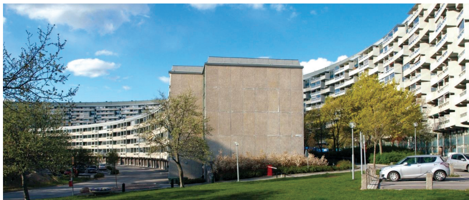
Fig. 4. Täby, Grindtorp complex

Znaczącym elementem tego osiedla są tereny zieleni. Oparte na współśrodkowych rzutach budynki wydzielają wewnętrzne przestrzenie przeznaczone przede wszystkim dla ruchu pieszego 9 . Pomiędzy domy wprowadzona została zielen w różnorodnych formach (il. 4). Najbliżej wejść do budynków dominują niskie formy ozdobne z miejscami odpoczynku i rekreacji wyposażonymi w elementy małej architektury. W obrębie wewnętrznego dziedzińca pozostawiony został naturalnie ukształtowany las na skalistym wzniesieniu.