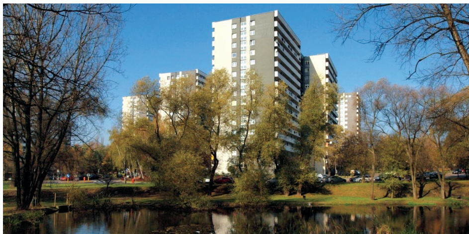
Fig. 6. Katowice, Tysiąclecie housing estate

ziomych linii płyt ograniczających balkony. Białe, gładkie wykończenie balkonów kontrastuje z ciemnymi pasami okien (il. 5b). Podobna zasada zastosowana została przy realizacji dominujących nad całym osiedlem pięciu wysokościowców. Znane jako „kukurydze” 18–26-kondygnacyjne budynki powstały na styku Tysiąclecia Dolnego i Górnego. Ich charakterystyczne bryły 13 są wynikiem zastosowania rzutu zbliżonego do 8-ramiennej gwiazdy i balkonów założonych na wycinku koła (il. 5c). Jasne pasy pełnych płyt balustrad tworzą regularny rytm wyraźnych poziomych podziałów. W ten sposób ukształtowana została jedna z ważniejszych cech wpływających na charakter osiedla (il. 6) [11, s. 181–187], [14, s. 409–410].