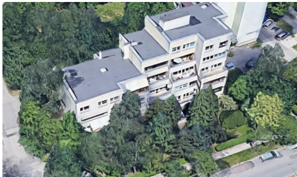
Rys. 2. Usytuowanie budynku

Budynek wielorodzinny, stanowiący przedmiot ekspertyzy budowlanej, jest zlokalizowany w południowo-zachodniej części wrocławskiego osiedla „Kuźniki” przy skrzyżowaniu ulic Dźwirzyńskiej i Sarbinowskiej. Od strony zachodniej granicę osiedla wyznacza rzeka Ślęza. Na terenie bezpośrednio przylegającym do budynku przy ul. Dźwirzyńskiej 2/4 występuje intensywna szata roślinna: drzewa liściaste – brzozy, dęby, topole oraz iglaste – świerki (rys. 2).