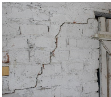
Rys. 4. Pęknięcia piwnicznych ścian działowych

W związku z powyższymi ustaleniami podjęto decyzję o konieczności wykonania badań podłoża gruntowego w rejonie bezpośrednio przylegającym do segmentu zachodniego klatki schodowej budynku. Zalecono wykonanie opinii geotechnicznej, która miała zawierać wnioski dotyczące możliwości występowania w tym rejonie gruntów spoistych charakteryzujących się skurczalnością wynikającą ze zmniejszania ich objętości podczas ich osuszania.