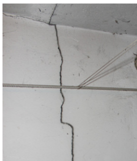
Rys. 3. Pęknięcia ścian zewnętrznych

południowej pęknięcia ujawniły się w polach podokiennych. Morfologia spękań piwnicznych ścian działowych była charakterystyczna dla nierównomiernego osiadania podłoża gruntowego w części środkowej budynku, a kierunek pęknięć wznosił się w stronę największych osiadań występujących w obrębie szczytowej ściany zachodniej (rys. 4).