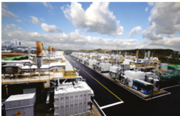
Rys. 2. Park ogniwi paliwowych Gyeonggi Green Energy o mocy 59 MW w mieście Hwasung w Korei Południowej