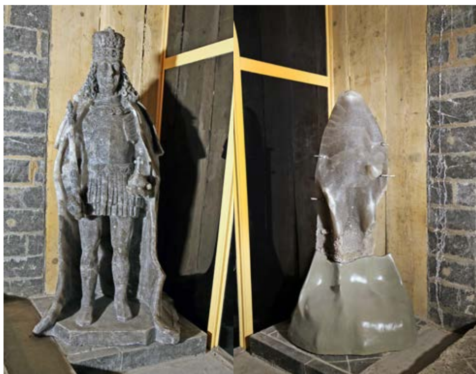
Ryc. 11. Pomniki Augusta II Mocnego w kaplicy Św. Antoniego. Fig. 11. Monuments of King August II in the Chapel of St. Anthony.

O wyborze gatunku soli decyduje temat i wielkość mającej powstać rzeźby. Wtedy podejmowana jest decyzja, czy rzeźba powstanie w soli spizowej (złoża pokładowego „Wieliczka”) czy w soli typowej zielonej (partia bryłowa złoża „Wieliczka”). Sól wykorzystywana przez rzeźbiarzy jest zawsze specjalnie wyselekcjonowana, tak aby nie miała przerostów soli jarczystej czy też nie była zanieczyszczona substancjami ilastymi. Tylko wtedy twórca może osiągnąć zamierzony efekt. Sól spizowa może być szara lub biała, jest jednolita, bardzo twarda, ale dzięki temu można lepiej oddać szczegóły danej rzeźby. Ze względu na swoją twardość łatwiej pracuje