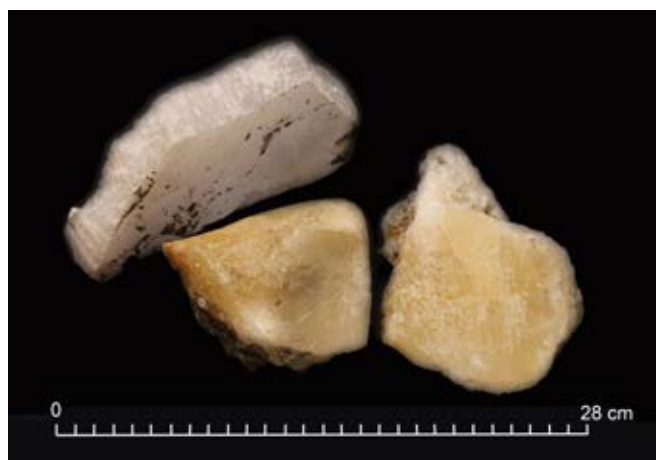
Ryc. 10. Różne odmiany wielickiej soli włóknistej. Fig. 10. Different varieties of fibrous salt from Wieliczka.