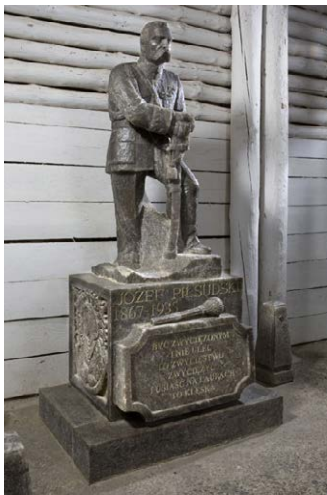
Ryc. 5. Stanisław Anioł, Józef Piłsudski . Fot. M. Gardulski Fig. 5. Stanisław Anioł, Józef Piłsudski , archive of the “Wieliczka” Salt Mine

Z upływem kolejnych dekad inspiracją dla obecnie pracujących górników-rzeźbiarzy stały się rzeźby ich poprzedników. Najokazalszym tego przykładem jest kaplica św. Kingi w Centrum Jana Pawła II w krakowskich Łagiewnikach. Powstała w 2013 roku, a jej wystrój wzorowano na wielickiej kaplicy św. Kingi (WOLAŃSKA A., SKUBISZ M., 2016)