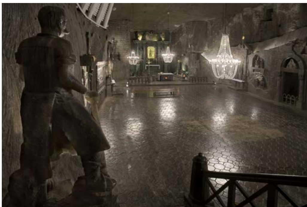
Ryc. 2. Kaplica Św. Kingi – widok ogólny. Fig. 2. Chapel of St. Anthony, the main altar.

W okresie międzywojennym (lata 1918-1939) prace rzeźbiarskie w wielickiej kopalni, przeprowadzano głównie