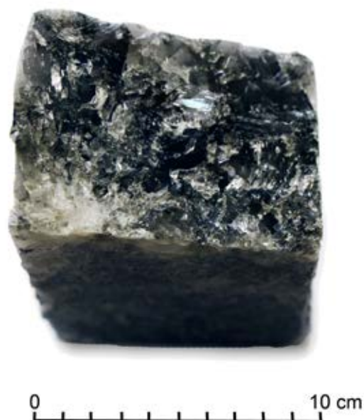
Ryc.6. Sól bryłowa typowa (ZBt) z komory Reiner I Górna, wykonano z niej pomnik Jana Pawła II.

Fig. 6. Typical green boulder salt (ZBt) from the Upper Reiner I Chamber, a statue of John Paul II was made out of it.