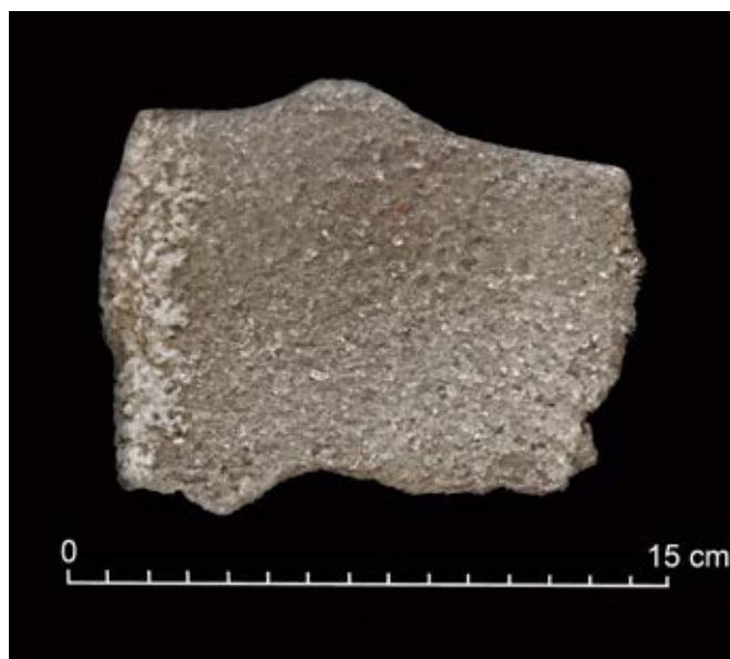
Ryc. 7. Sól spizowa, fragment z figury Augusta II Sasa wykonanej w XVII w. Fot. J. Przybyło

Fig. 7. Spiza salt, a fragment of the figure of King August II made in the 17th century. Photo: J. Przybyło