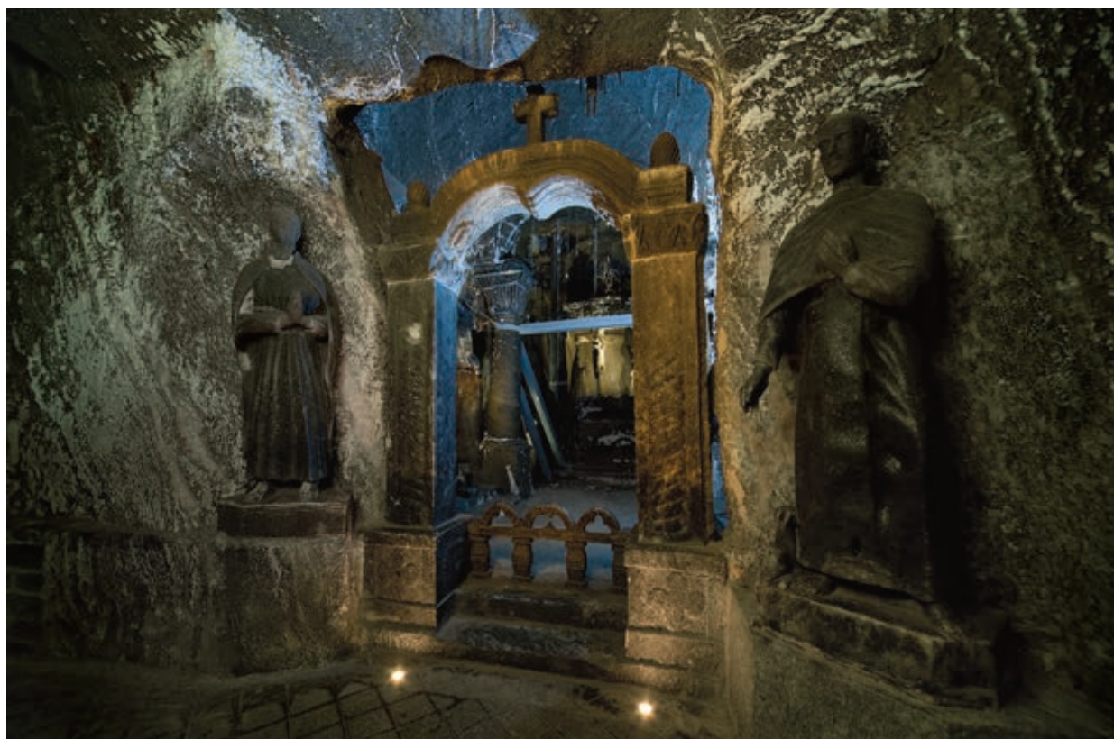
Ryc. 1. Kaplica Św. Antoniego (Św. Dominik, Św. Franciszek). Fig. 1. Chapel of St. Anthony (St. Dominic, St. Francis).

Pierwsi wykonawcy prac rzeźbiarskich w wielickiej kopalni pozostają nieznanymi. Najstarsze dzieła zrealizowane przez anonimowych górników-rzeźbiarzy, które zachowały się do naszych czasów datuje się na wiek XVII. Nieznane pozostają nazwiska twórców późnobarokowej kaplicy św. Antoniego (lata 1698 – 1710). Czy byli to górnicy-rzeźbiarze-samoucy, czy raczej dobrze wykształceni w plastycznym kunszcie mistrzowie? Na to pytanie na razie nie udało się znaleźć odpowiedzi. Jednak biorąc pod uwagę wysokie walory architektoniczno-rzeźbiarskiego założenia zrealizowanego w kaplicy św. Antoniego, można postawić hipotezę, że nie byli to prości górnicy-samoucy, a mistrzowie w swoim fachu. Anonimowe pozostają również postacie rzeźbiarzy, którzy pracowali w kaplicy św. Krzyża w komorze Lizak (lata 1710-1730). Przyjmuje się, że byli to ci sami, którzy ukończyli najpierw prace w kaplicy św. Antoniego. Wiemy, że przewodził im ten sam majster (mistrz), który zginął podczas prac rzeźbiarskich w komorze Lizak. Ten fakt odnotowano w protokołach komisji królewskich, jednak nie zapisano jego nazwiska, a jedynie funkcję (KALWAJTYS E., 2011). Pierwsze nazwiska rzeźbiarzy, jakie znamy pochodzą z lat 50. XIX wieku, kiedy to przeprowadzano renowację kaplicy św. Antoniego. Byli to: sztygar Alojzy Nürenberg (Nürenberger), stojak Peller oraz stolarz Lepiarski (KALWAJTYS E., 1996).