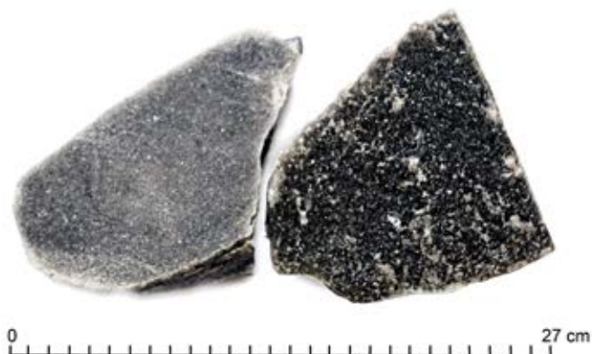
Ryc. 9. Sól spizowa z IV poziomu kopalni wielickiej, wykonano z tego gatunku soli figurę św. Kingi do Tokio. Fig. 9. Spiza salt from the 4th level of the "Wieliczka" Mine, a figure of St. Kinga to Tokyo was made out of it.