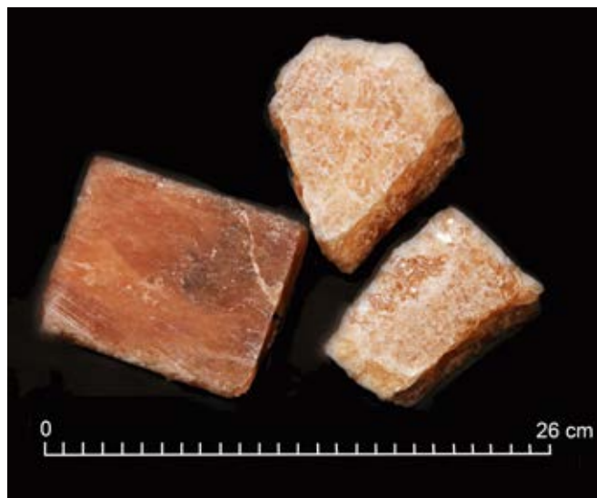
Ryc. 13. Sól różowa z Kopalni Soli Kłodawa.

Kilkuniekowa tradycja rzeźbienia w soli, która początki swe wywodzi z kopalń soli kamiennej, nadal jest podtrzymywana i kontynuowana. Mecenat Zarządów Kopalń sprawia, że nowopowstałe rzeźby zdobią turystyczne komory. W Wieliczce wciąż żywe jest rzeźbienie w soli i ma ono również