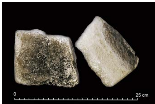
Ryc. 12. Sól spizowa z rejonu szybu Wilson, wykonano z niej figurę Augusta II Sasa w 2016 roku.

Fig. 12. Spiza salt from the area of the Wilson shaft, used to make a statue of King August II in 2016.