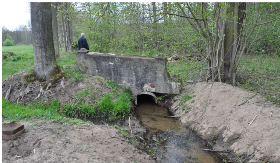
Fot. 4. Ceglany mostek po zachodniej stronie Zwierzynca [Eckert 2016] Phot. 4. A brick bridge on the western side of the Animal Park [Eckert 2016]

Wśród materiałów archiwalnych, głównie ikonograficznych, które dokumentują kolejne etapy przekształceń pałacu, parku i folwarku jedynym potwierdzeniem istnienia Zwierzynca są dawne mapy. Thier Garten pojawia się na najstarszym zachowanym planie Zatonia pochodzącym z 1851 r. Pomiędzy nim a pałacem znajdowały się wówczas zabudowania mieszkalno-gospodarcze, rozległa łąka ( Grosse Wiese ) i ogród ( Erbe Garten ). Nie był bezpośrednio skomunikowany z pałacem, najkrótsze dojście stanowiła odnoga odchodząca od głównej drogi Zielona Góra - Kożuchów. Na planie nie zaznaczono zasięgu Zwierzynca. Możliwe, że jego centralnym miejscem było niewielkie rondo ulokowane na skrzyżowaniu prostopadłych do siebie dróg. Oprócz nich funkcjonowały drogi prowadzone łagodnymi liniami łączące się z polniami. Na jednej znajdował się mały placyk założony na rzucie koła. Teren poprzecinany był strumieniami i kanałami, z których woda spływała do Dłubni. Na planie nie zaznaczono żadnych budowli. Mapa topograficzna z 1933 r. potwierdza, że układ komunikacyjny i wodny uległ w międzyczasie niewielkim zmianom: na głównym skrzyżowaniu nie wrysowano już ronda, brakuje kilku dróg, nie ma okrągłego placu. Obszar oznaczono jako las liściasty, częściowo podmokły. Teren przed nim od strony wsi nadal zajmowała łąka, natomiast po stronie północnej rozciągał się las iglasty.