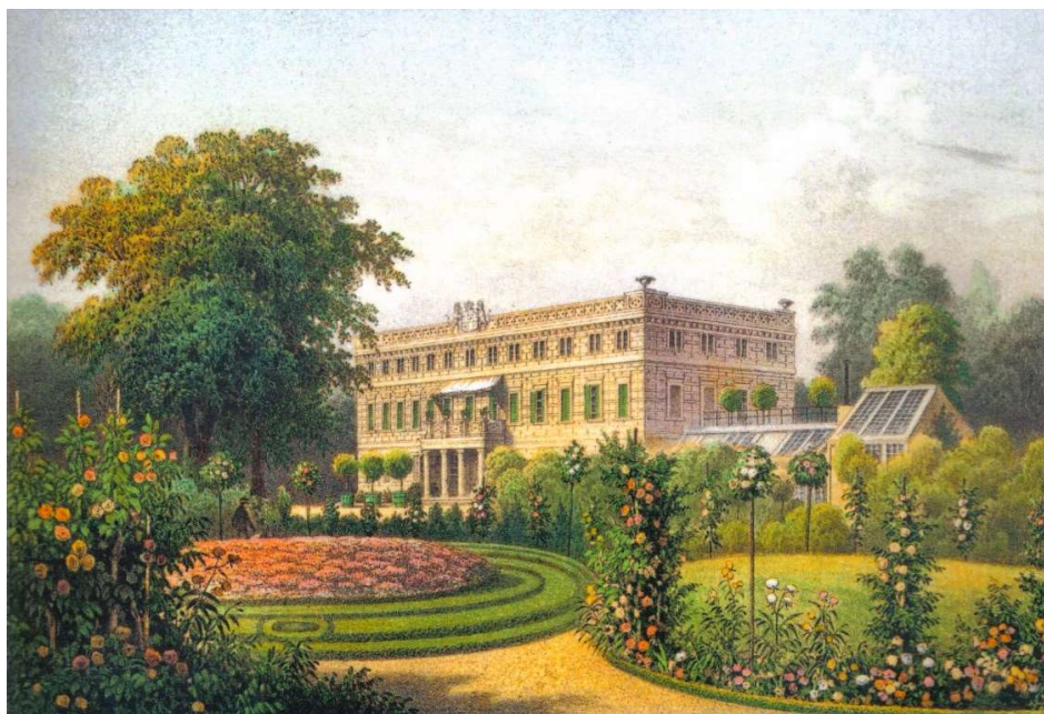
Rys. 1. Pałac w Zatoniu. Litografia A. Dunkera z połowy XIX w. w: Die ländlichen Grundbesitzer in der preussischen Monarchie, 1860 r.

Zwierzynce zakładano w pozamiejskich rezydencjach. Były to tereny leśne, najczęściej przyległe do ogrodu, które obejmowano wspólną kompozycją przestrzenną. Zakładano je głównie do urządzania polowań. Zdarzało się, że dominującą funkcją stawała się obserwacja zwierząt i wówczas, w łatwo dostępnych częściach zwierzynca, organizowano skupione kolekcje zwierząt, tzw. menażerie. W odróżnieniu od terenów łowieckich, gdzie zwierzęta żyły swobodnie, w menażeriach tworzone zagrody, pawilony i wybiegi. Zwierzętami opiekowano się. Oprócz budowli związanych z ich ekspozycją wznoszono zabudowania konieczne do ich utrzymania. Menażerie dały początek ogrodom zoologicznym, które zaczęto zakładać na początku XIX w. w pierwszej kolejności w dużych miastach. Nie służyły już ograniczonemu kręgowi odbiorców, a były ogrodami publicznymi. Oprócz funkcji rekreacyjnej zaczęły spełniać również rolę placówek naukowych, w których zajmowano się badaniem żywych zwierząt, ich aklimatyzacją i popularyzacją.