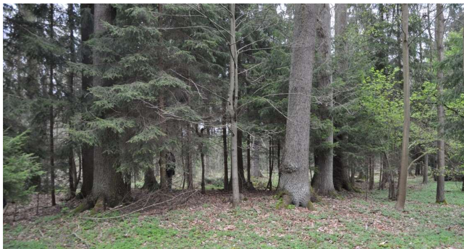
Fot. 2. Skupina drzew w południowej części Zwierzynca [Eckert 2016] Phot. 2. A group of trees in the southern part of the Animal Park [Eckert 2016]

Rozbudowano też ogrodnictwo, które specjalizowało się w uprawie owoców, warzyw i kwiatów przeznaczonych na potrzeby dworu. Za czasów baronowej Renaty powiększono park w kierunku południowym i wschodnim o część leśną. Po 1945 r. nastąpiło częściowe zalesienie parku. Obecnie park zajmuje powierzchnię 52,37 ha [Adamek-Pujczo 2013].