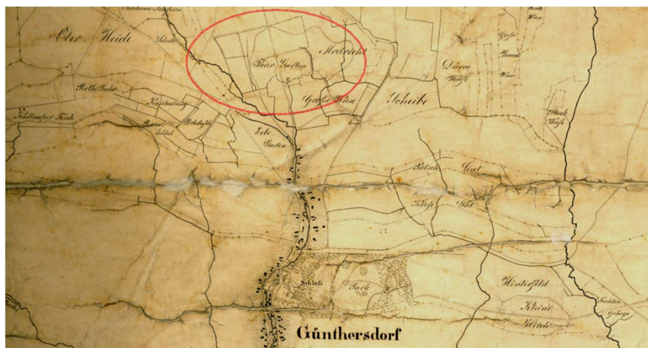
Rys. 2. Plan Zatonia z 1851 r. Czerwonym kolorem oznaczono Zwierzyniec [Messtichblatt]