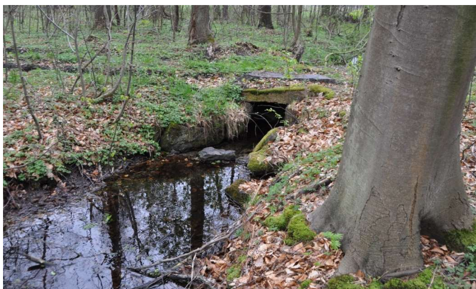
Fot. 3. Przejście nad strumieniem wykonane z kamiennych bloków [Eckert 2016] Phot. 3. A crossing over the stream made of stone blocks [Eckert 2016]