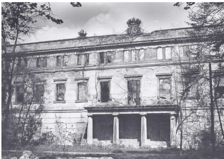
Fot. 1. Pałac w Zatoniu. Elewacja frontowa. Zdjęcie z 1972 r. [Lukas 1972] Phot. 1. The palace in Zatonie. The front elevation. A photograph from 1972 [Lukas 1972]

W 2 poł. XVII w. majątek przeszedł w ręce Baltazara von Unruh, który w 1689 r. wznosił tutaj murowany dwór. Po 1757 r., kiedy zmarł ostatni z rodziny Unruhów na Zatoniu, majątek wielokrotnie przechodził z rąk do rąk. W 1809 r. jego właścicielką została księżniczka kurlandzka Dorota Biron, późniejsza księżna de Talleyrand-Périgord. Z jej inicjatywy przebudowano dwór, wzniesiono przy nim oranżerię i cieplarnię, rozbudowano ogrodnictwo oraz powiększono ogród tworząc park krajobrazowy. W 1871 r. Alexander de Talleyrand-Périgord przebudował cieplarnię oraz wznosił kordegardy, a kolejna właścicielka Renata von Lancken-Wakenitz przebudowała pałac, powiększyła park w kierunku wschodnim o część leśną (przed 1905 r.), a w latach 1935-1937 wzniosła leśniczówkę. W 1945 r. spłonął pałac z przyległą cieplarnią i palmiarnią [Kowalski]. Po II wojnie światowej majątek podzielono, pałac i park przejęły Lasy Państwowe, natomiast folwark - Państwowe Gospodarstwo Rolne [Adamek-Pujczo 2013].