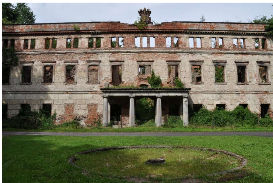
Fot. 5 Pałac w Zatoniu. Elewacja frontowa. Stan obecny, [Eckert 2016] Phot. 5. The palace in Zatonie. The front elevation. Present condition. [Eckert 2016]