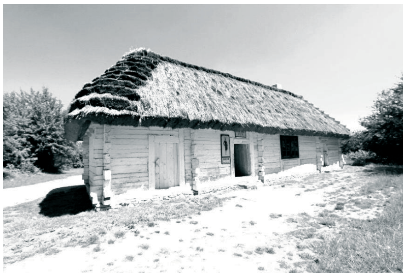
Fot. 1. Chałupa z Szydłowa – prawdopodobnie najstarszy przykład tego typu budownictwa ludowego. Dobrze widoczna jest konstrukcja na węgiel, wejście od strony szerszej ściany oraz mieszane pokrycie czterospadowego dachu. Autor: Muzeum Wsi Kieleckiej

I tak wydaje się, że na Kielecczyźnie najczęstszym typem jest chałupa drewniana szerokofrontowa (z wejściem w ścianie dłuższej), z sienią umieszczoną centralnie albo niesymetrycznie, bliżej jednej ze ścian szczytowych, do której z jednej strony przylega izba a z drugiej komora. Dobrym przykładem takiej budowli jest chałupa z Szydłowa wybudowana w 1705 roku, obecnie znajdująca się w oddziale Muzeum Wsi Kieleckiej w Parku Etnograficznym w Tokarni [5].