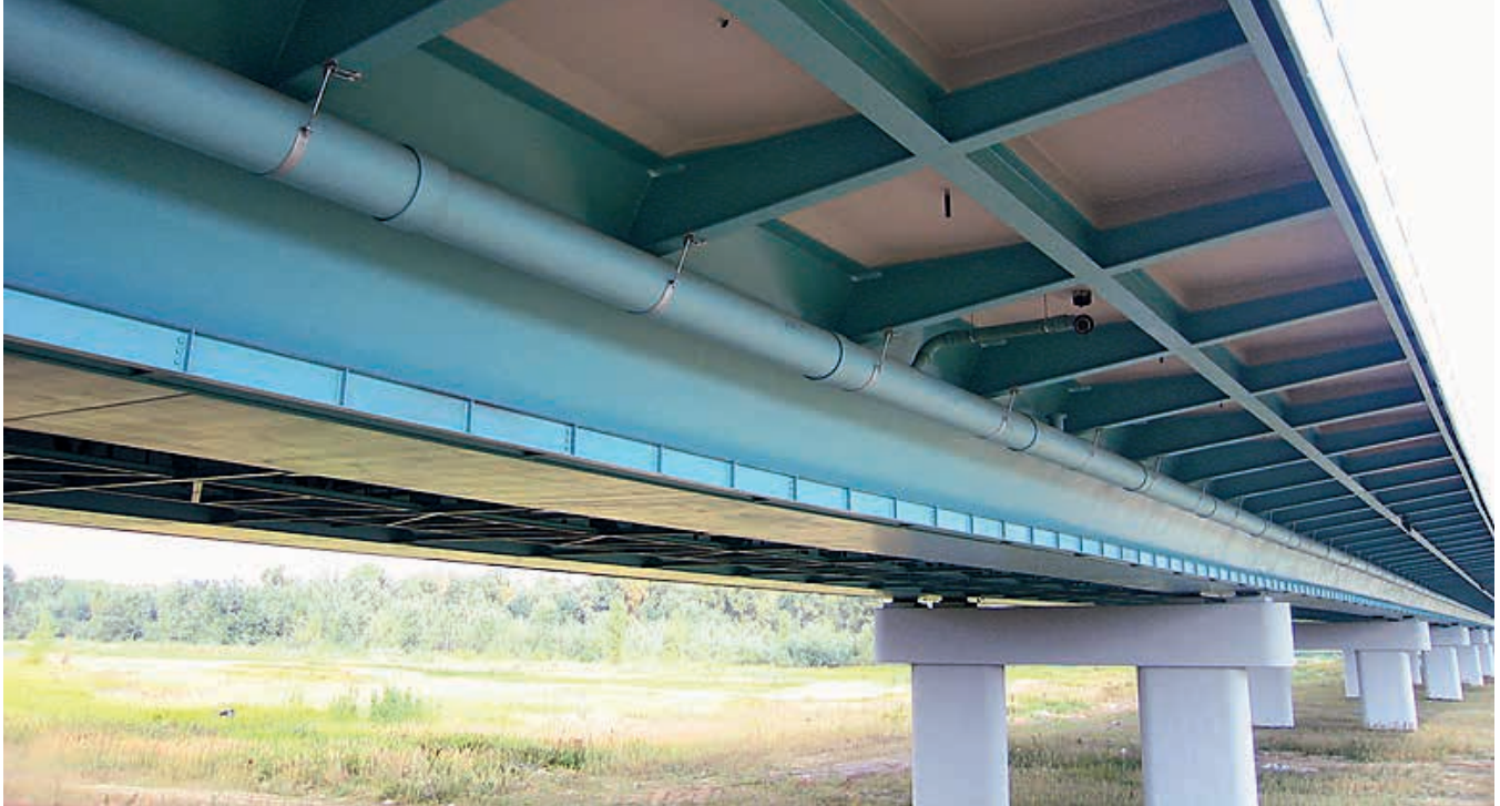
Odwodnienie obiektu mostowego przewodami z tworzywa GRP [6]