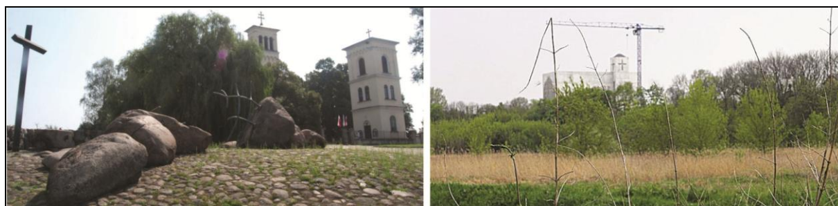
Fot. 1. Kościół Św. Katarzyny w Służewie i kościół Bł. Edmunda Bojanowskiego w Wolicy. Photo 1. St. Catherine church in Służew and Blessed Edmund Bojanowski church in Wolica.

kościół stanowi gęsta zabudowa osiedli mieszkaniowych. Często zespoły kościelne zajmują niewielką przestrzeń, graniczącą bezpośrednio z wysokimi blokami osiedlowymi lub domami jednorodzinnymi. Szczególnie negatywne wrażenie wywierają kościoły włoczone w wysoką, zwartą zabudowę bloków wielorodzinnych. Takim przykładem jest kościół NMP Matki Miłosierdzia, otoczony wysokimi blokami osiedla Stegny (fot. 4). Takie zagospodarowanie terenu wokół dominanty utrudnia jej dobrą ekspozycję. Na pogorszenie odbioru widoku kościoła wpływa często parkowanie samochodów wzdłuż drogi dojazdowej prowadzącej do kościoła lub przed głównym wejściem do świątyni.