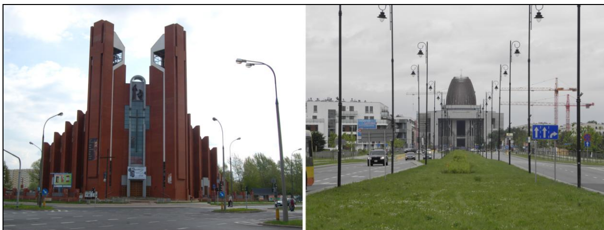
Fot. 3. Kościół Św. Tomasza Apostoła na Imielinie i Świątynia Opatrzności Bożej w Wilanowie. Photo 3. St. Thomas the Apostle church in Imielin and the Temple of the God's Providence in Wilanów.