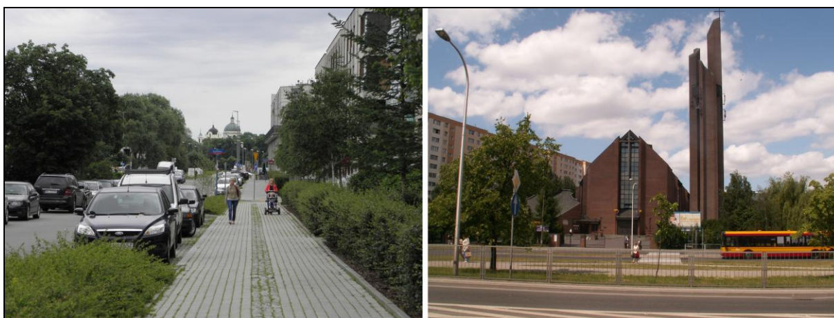
Fot. 4. Kościół Św. Anny w Wilanowie i kościół NMP Matki Miłosierdzia na Stegnach. Photo 4. St. Anna church in Wilanów and Our Lady the Mother of Mercy church in Stegnach.