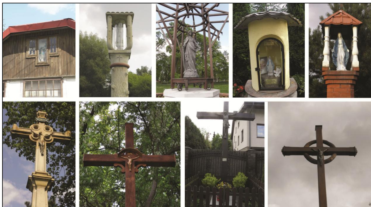
Fot. 2. Przykłady krzyży i kapliczek przydrożnych zlokalizowane na terenie badań. Photo 2. Examples of roadside crosses and shrines located in the research area.