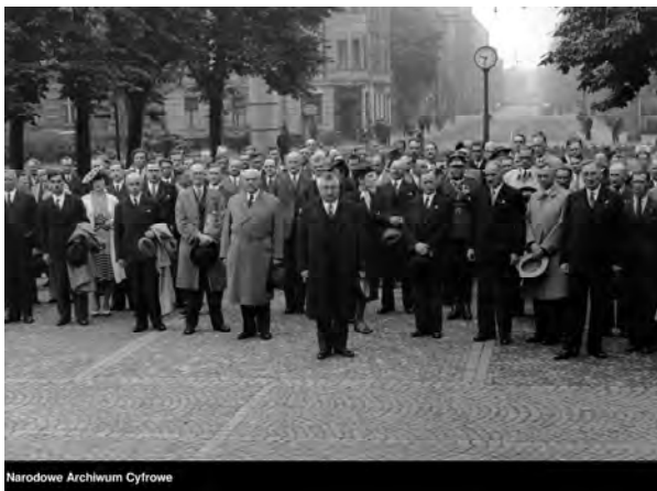
Rys. 3. Uczestnicy Zjazdu na Placu Wolności w 1939 roku