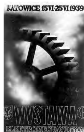
Rys. 1. Plakat wystawy towarzyszącej WZD