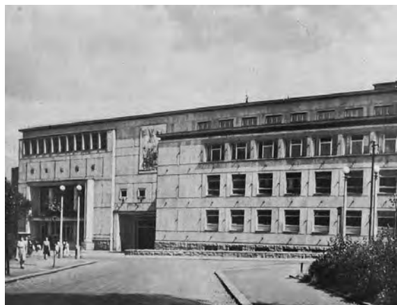
Rys. 5. Miejsce Zjazdu – Pałac Młodzieży w Katowicach, fot. z lat 1957-1960

W okresie tym dużym wyróżnieniem dla Oddziału Zagłębia Węglowego SEP było powierzenie mu organizacji X Walnego Zjazdu Delegatów SEP.