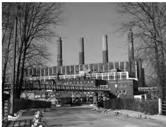
Rys. 6. Elektrownia Miechowice, dzisiaj nie istnieje

Po obradach uczestnicy zwiedzili obiekty energetyczne i przemysłowe według zainteresowań: elektrownię w Miechowicach, stacje transformatorowe w Trzebinie i Mikulczycach, kopalnie w Katowicach, Szombierkach i Chorzowie oraz huty Bobrek i Kościuszko.