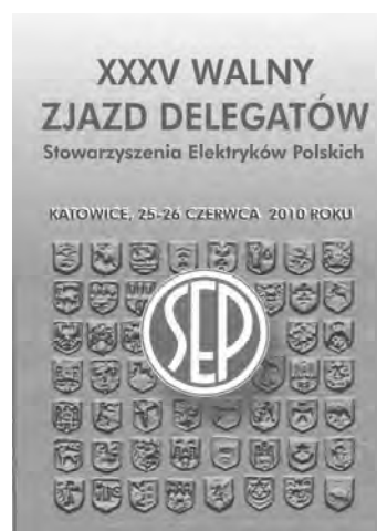
Rys. 7. Plakat Zjazdowy

W 71 lat po pierwszym i w 54 lata po drugim w Katowicach odbył się trzeci Walny Zjazd Delegatów SEP. W dniach od 25 do 26 czerwca 2010 r. na widowni Teatru Śląskiego im. Stanisława Wyspiańskiego w Katowicach zasiedli wybrani w Oddziałach delegaci 50 Oddziałów SEP wraz z Członkami Honorowymi Stowarzyszenia, łącznie w liczbie 216 osób (na 256 uprawnionych do głosowania), zapewniając kworum niezbędne do prawomocności podejmowanych uchwał Zjazdu.