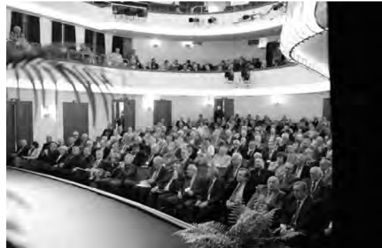
Rys. 10. Uczestnicy WZD w Teatrze Śląskim im. Stanisława Wyspiańskiego w Katowicach