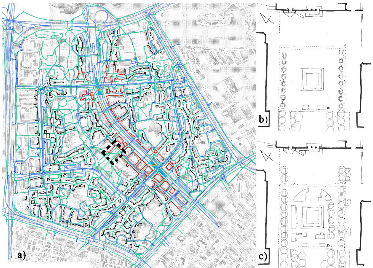
Il.1. Plac przed kościołem Wniebowstąpienia Pańskiego na Ursynowie Północnym: a) usytuowanie w sieci powiązań, b) plac – stan istniejący, opracowanie własne. c) schemat projektu przekształcenia posadzki placu.

Ill. 1. The Church of the Ascension square in North Ursynów: a) location in the walkway network, b) the existing state of the square, c) scheme of the designed transformation.