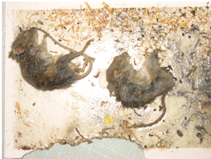
Rys. 3. Pułapka lepowa ze sklepu ze złapanymi myszami domowymi (na dole widoczne ślady żerowania innych osobników)