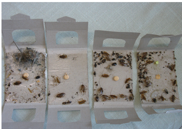
Rys. 2. Karaczan niemiecki ( Blattella germanica ) w pułapkach feromonowo-lepowych z mieszkania Fig. 2. The German cockroach ( Blattella germanica ) in pheromone-glue traps from an apartment

Na czynnik odłowu w danej pułapce wpływało także miejsce wyłożenia pułapek (rys. 2). Największą liczbę karaczanów w różnych stadiach rozwojowych stwierdzano w pułapkach umieszczonych w okolicy lodówek, magazynów z żywnością, kranów z wodą, kuchenek mikrofalowych.