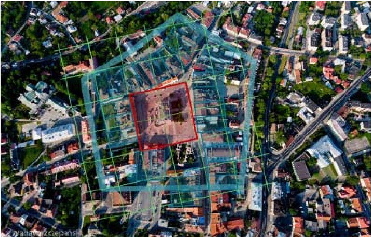
Il. 3 Współczesne zdjęcie lotnicze dawnego miasta lokacyjnego z naniesioną siatką sznurową, opracowanie autorki