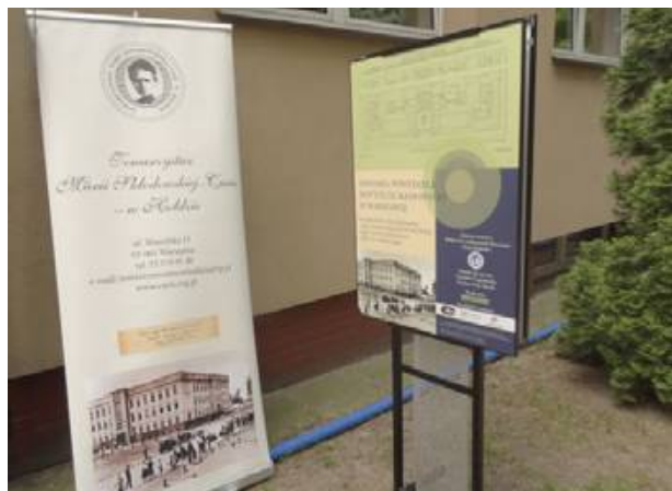
Fot. 3. Wystawa o historii Instytutu Radowego przygotowana przez Towarzystwo Marii Skłodowskiej-Curie w Hołdzie prezentowana podczas uroczystości

Po części oficjalnej przy pomniku Marii Skłodowskiej-Curie złożono kwiaty. Białe róże, które tak lubiła uczona, wiązanki białych, biało-czerwonych oraz kwiatów w kolorach flagi francuskiej pokryły stopnie pomnika.