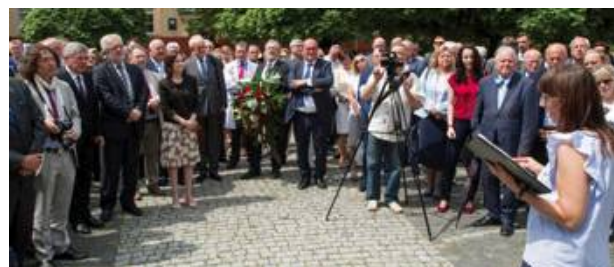
Fot. 4. Zgromadzeni goście Photo 4. The gathered guests

Następnie zebrani mieli wyjątkową okazję zwiedzić ogród Instytutu, to miejsce, które z taką dbałością ze względu na dobro pacjentów i lekarzy zaprojektowała sama Maria Skłodowska-Curie. Znajduje się tam także drzewo posadzone 85 lat temu przez uczoną- klon jawor, które od kilku już lat cieszy się mianem „drzewa-pomnika prawem chronionego”.