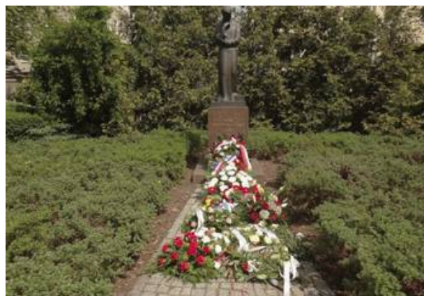
Fot. 2. 29 maja 1932 r. Pomnik Marii Skłodowskiej-Curie przy ul. Wawelskiej cały w kwiatkach

dyrektor Centrum Onkologii, prezes Polskiego Towarzystwa Onkologicznego, prezes Polskiego Towarzystwa Lekarskiego, prezes honorowy Towarzystwa Marii Skłodowskiej-Curie w Hołdzie. W uroczystości uczestniczyli lekarze, personel medyczny placówki, onkolodzy, przedstawiciele organizacji medycznych, chemicznych, fizycznych, biologicznych. Przybyło także bardzo wielu mieszkańców Warszawy. Przy pomniku Marii Skłodowskiej-Curie stanęły poczty sztandarowe trzech szkół; 38 Gimnazjum noszącego imię uczoney, XXIII Liceum Ogólnokształcące imienia Marii Skłodowskiej-Curie oraz Technikum Kolejowe. Poczty sztandarowe tych szkół towarzyszą we wszystkich uroczystościach organizowanych przez nasze Towarzystwo.