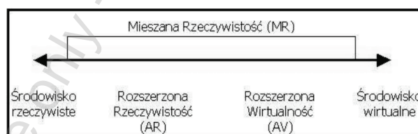
Rys. 2. Schemat ciągłości rzeczywistość-wirtualność [7]

Rzeczywistość może być „rozszerzana” o wirtualne obiekty, analogicznie do tego świat wirtualny może być „rozszerzany” przez rzeczywiste obiekty [8]. Takie Środowisko nazywane jest Rozszerzoną Wirtualnością (Augmented Virtuality, AV) i na schemacie ciągłości rzeczywistość – wirtualność umiejscowiona jest tuż przy środowisku wirtualnej rzeczywistości [8].