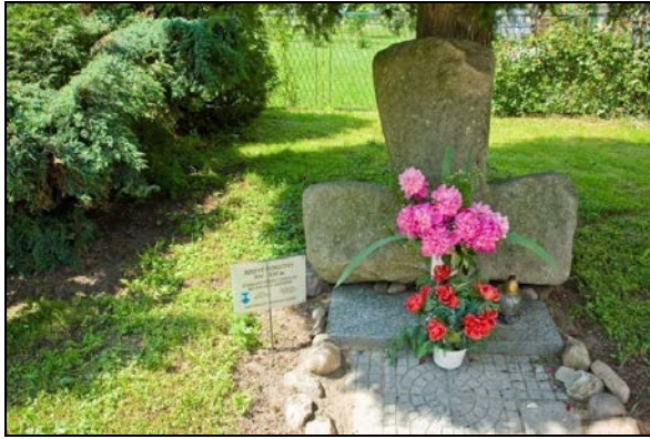
Fot. 1. Fragment największego znanego krzyża kamiennego znajdujący się w Stanowicach.

Photo 1. A fragment of the biggest of the known stone crosses, located in Stanowice.