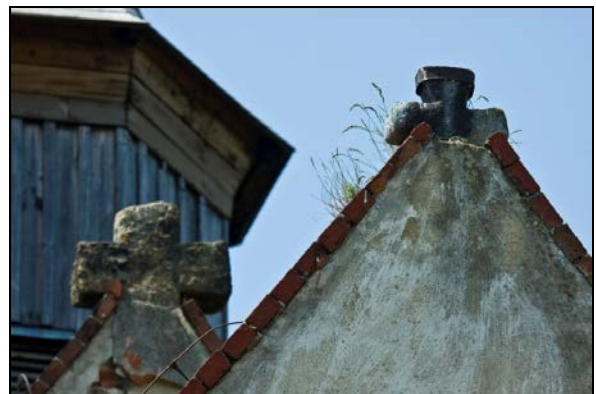
Fot. 4. Krzyże kamienne na dachu kościoła św. Bartłomieja w Modliszowie.

Photo 3. A cluster of penitential stone crosses in Wierzbna.