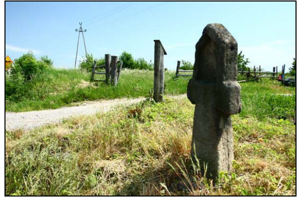
Fot. 2. Kapliczka połączona z krzyżem kamiennym w Modliszowie.

Photo 1. A fragment of the biggest of the known stone crosses, located in Stanowice.