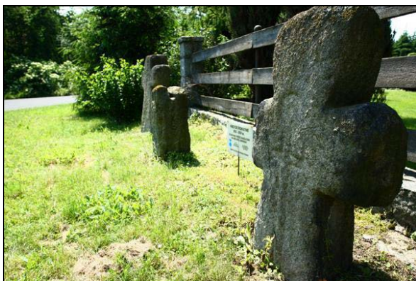
Fot. 5. Ryt miecza na krzyżu kamiennym w Bolesławicach.

Photo 4. Stone crosses in the roof of St. Bartholomew church in Modliszów.