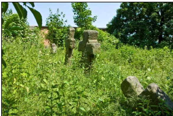
Fot. 3. Zgrupowanie krzyży kamiennych w Wierzbnej.

Photo 2. A shrine with a penitential stone cross in Modliszów.