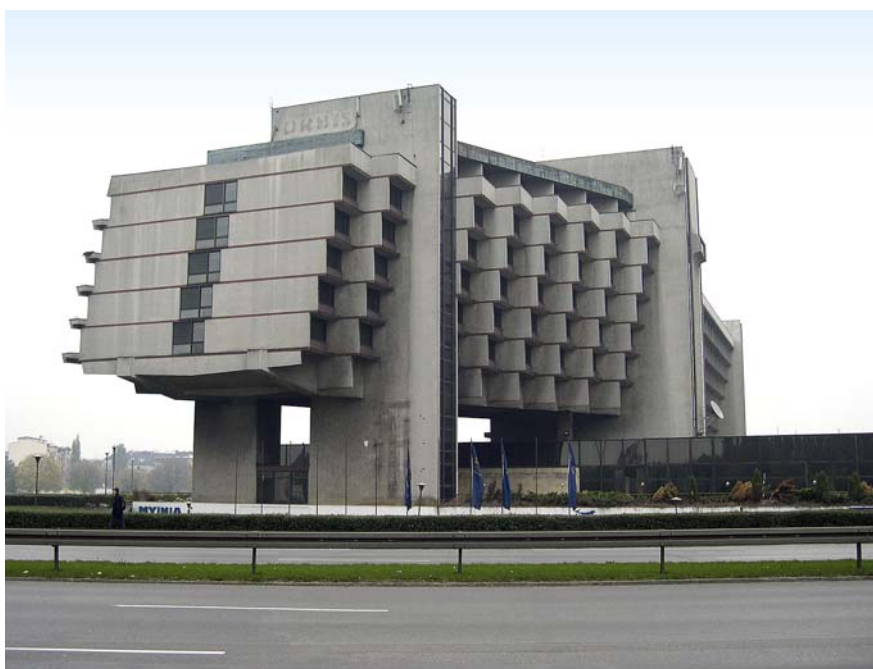
Ryc. 1. Hotel Forum w Krakowie, widok od strony ul. Marii Konopnickiej, 2003 r., źródło: https://pl.wikipedia.org/wiki/Janusz_Ingarden#/media/File:Forum_Kraków_10-2003.jpg

could be confirmed also by the fact that it was one of the 7 structures from the region of Małopolska to be mentioned in the 20 th edition of Sir Banister Fletcher's A History of Architecture 6 . The design of the Forum hotel was one of the last works by the distinguished architect Janusz Ingarten. After 1949 he was engaged in the design and erection of Nowa Huta 7 , since the end of the 1950s he worked in the office of the main architect of the city of Cracow, when he actually departed from the socialist realism towards modernist forms 8 . The massive form of the Forum hotel is supported by six pairs of reinforced concrete posts, creating a clearance which opens the view of the Wawel hill and the Skałka church to drivers arriving to Cracow from the direction of Zakopane. Above this 'openwork' ground floor there hover a technical floor and five hotel floors. A 110m-