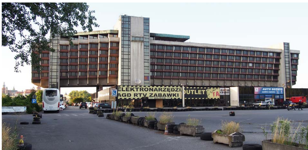
Ryc. 3. Hotel Forum w Krakowie, widok od strony południowej, 2016 r., fot. J.J.Białkiewicz

In the resulting conflict, the defenders of the hotel refer to the objective value of its modernist architecture, whereas advocates of its demolition speak of obsolete structural solutions which render it impossible to adapt it to the current standards. The main charge is the height of individual floors of the building, ranging from 2.20 to 2.48. Therefore, the rooms are definitely too low