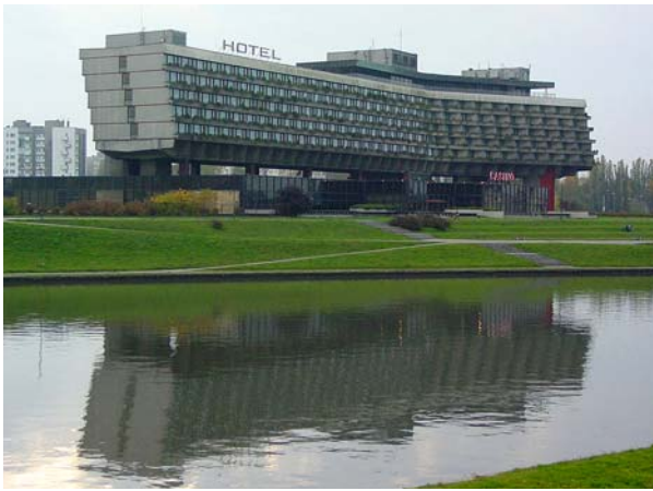
Ryc. 2. Hotel Forum w Krakowie, widok od strony rzeki Wisły, 2002 r.