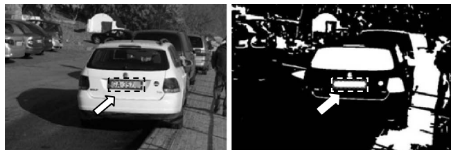
Rys. 3. Wynik działania wykrywania i lokalizacji tablicy na obrazie cyfrowym - Etap II algorytmu AWiRTR, kroki 2 i 3: przykładowy surowy obraz początkowy (lewy) oraz po przekształceniach (prawy), ze wskazaną lokalizacją tablicy rejestracyjnej

Na rysunku 3 strzałką wskazano lokalizację obiektu, który na podstawie przedstawionych wyżej wskaźników został zidentyfikowany na obrazie cyfrowym pojazdu jako tablica rejestracyjna (rys. 3 - prawy).