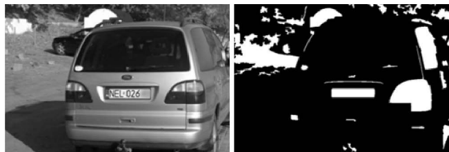
Rys. 2. Wynik działania przekształceń Etapu I algorytmu AWiRTR, krok 1: przykładowy „surowy” obraz cyfrowy początkowy (lewy) i obraz cyfrowy po przekształceniach (prawy)

Celem Etapu II algorytmu AWiRTR jest identyfikacja tablicy rejestracyjnej spośród wszystkich wyróżnionych w trakcie Etapu I obszarów, a następnie wskazanie jej