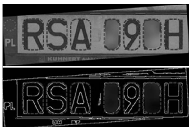
Rys. 4. Wynik działania segmentacji znaków na obrazie cyfrowym tablicy rejestracyjnej z Etapu III algorytmu AWiRTR, kroki 4: wczytany obraz RGB tablicy rejestracyjnej (górną część) oraz obraz po przekształceniach i korekcji pochyleń (dolną część)

Wyselekcjonowane i przetworzone obrazy znaków zostają przygotowane do ich klasyfikacji (rozpoznania) przez sztuczną sieć neuronową w Etapie IV algorytmu. Każdy znak w postaci binarnej jest postrzegany jako macierz, której elementami są wyłącznie zera i jedynki. Wszystkie znaki są następnie skalowane do standardowego rozmiaru o wysokości 44 pikseli i szerokości 33 pikseli. Następnie macierze poszczególnych znaków są konwertowane na odpowiednie wektory (o liczbie wierszy