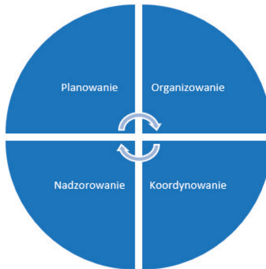
Rys. 1. Graficzne ujęcie idei kierowania działaniami ratowniczymi

Ukazane powyżej typy działań stanowiące podstawę zarządzania organizacjami, podobnie jak opisane wcześniej funkcje kierownicze, aktywizowane powinny być przez osobę przewodzącą pracy danego zespołu w sposób nieustanny do momentu osiągnięcia zakładanego celu. Opisywane obszary zadaniowe bliźniaczo nawiązują do zakresu kierowania działaniem ratowniczym będącego podstawą zadaniowego podejścia do obowiązków przez KDR. Sprawne kierowanie działaniem ratowniczym wymaga literalnego (zgodnie z właściwym rozporządzeniem ws. szczegółowej organizacji krajowego systemu ratowniczo-gaśniczego ) wypełniania zakresu kierowania działaniem ratowniczym, co ukazano na rys. 1.