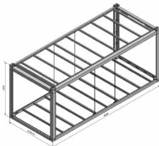
Rys. 2. Przykładowa rama stalowa modułu [7] i [8]

Powyższe rozważania wskazują więc na dominację betonu jako materiału konstrukcyjnego we współczesnej prefabrykacji. Zastosowanie drewna można – w skali ogólnej produkcji budowlanej – uznać za niewielkie, również stosowanie konstrukcji stalowych jest dość ograniczone. Stwarza to doskonałe perspektywy dla betonu jako materiału konstrukcyjnego zarówno od strony inżynierii materiałowej (betony innowacyjne), jak i technologii oraz techniki budowania. Autorzy przewidują, że prefabrykacja betonowa w ciągu nadchodzących lat będzie przeżywała dynamiczny rozwój.