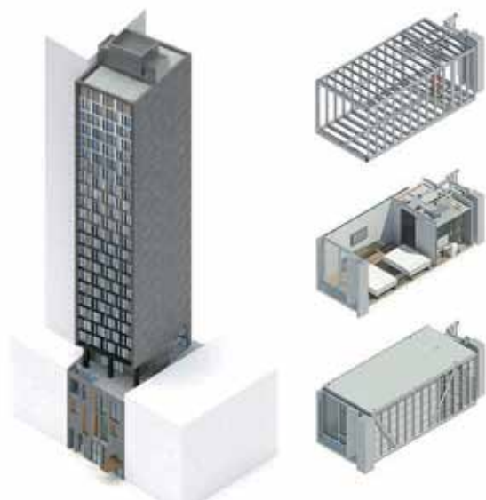
Rys. 3. Wizualizacja najwyższego budynku hotelowego zaprojektowanego przez Danny Forster & Architecture w systemie budownictwa modułowego, przewidywany czas montażu – 90 dni

W fazie projektowej budynki dzielone są na sekcje (prefabrykowane moduły budowlane wytwarzane w ok. 90% w zakładach produkcyjnych), następnie transportowane na miejsca przeznaczenia i łączone w celu utworzenia jednej bryły budynku (rys. 3 i 4). Na etapie prefabrykacji moduły są dodatkowo wyposażane we wszystkie objęte projektem instalacje, ściany wewnętrzne oraz części elementów wykończenia. Po zestawieniu modułów na placu budowy następuje połączenie instalacji oraz prace uzupełniające w zakresie wykończenia. Proste zasady łączenia i montażu modułów umożliwiają szybkie wykonanie budynków gotowych do użytkowania we wskazanych miejscach, co