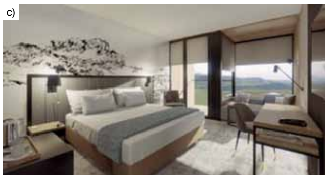
Rys. 4. Projekt hotelu 4-gwiazdkowego w Szklarskiej Porębie; technologia mieszana, w technologii modułowej zastosowano 280 modułów: a) wizualizacja budynku, b) projekt aranżacji wnętrza pojedynczego modułu, c) wizualizacja typowego pokoju

przede wszystkim oszczędza czas i koszty. Przykładowo budowa szpitala modułowego dla 1000 pacjentów w chińskim Wuhan na okoliczność możliwej ekspansji epidemii wirusa 2019-nCoV o powierzchni 25 tys. m 2 trwała 10 dni. W przypadku konieczności można też w prosty i łatwy sposób zwiększać lub zmniejszać wielkość budynków przez dodanie lub odłączenie kolejnych modułów, jak również można przenosić całe budynki w inne miejsca [9]. Obiekty wykonane w technologii modułowej nazywane są budynkami modułowymi.