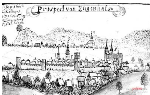
Ryc. 1. Panorama Glucholazy, sztych F.B. Wernera z 1729 r.

drogowych nawierzchni spowodowały, że z czasem utraciły one swój staromiejski charakter. Budynki mieszkalne zlokalizowane w centrum miasta reprezentują standard nieadekwatny do rangi i prestiżu centrum, a zatem wpływają na niską jakość przestrzeni, jej kompozycji i wyposażenia terenów koncentracji usług, w tym lokalnych ośrodków usługowych. W niektórych przypadkach można zauważyć brak użytkownika lub użytkowanie obiektów zabytkowych w niewłaściwy sposób [1].