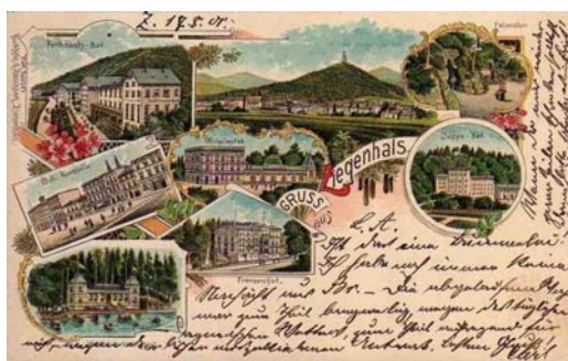
Ryc. 2. Przedwojenna widokówka z budynkami kurortu Bad Ziegenhals.

Fig. 1. Panorama of Glucholazy, print of F.G. Werner of 1729.