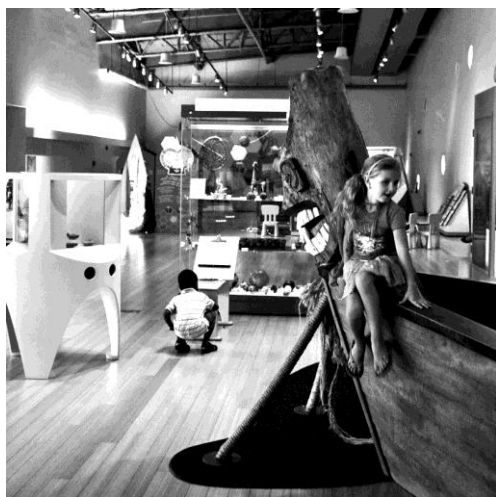
Ryc. 3. Brooklyn Children's Museum, ekspozycje na drugim piętrze.

Na skutek zmian muzeum powiększyło się o dwa nowe piętra z biblioteką, galerią, klasami lekcyjnymi i kawiarnią, pomieszczeniami dla dzieci młodszych (od 2 do 6 lat), salką komputerową i pokojem urodzinowym, rozległym zewnętrznym tarasem, amfiteatrem oraz, oczywiście, pomieszczeniami najważniejszymi, to znaczy przeznaczonymi na interaktywne wystawy poświęcone nauce, sztuce i przyrodzie (ryc. 3, 4). Co ciekawe, budynek zyskał certyfikat przyznawany przez United States Green Building Council's Leadership in Energy and Environmental Design (LEED), ponieważ wykorzystano w nim materiały z odzysku, np. do wykończenia posadzek, panele fotowoltaiczne, źródła wód geotermalnych do ogrzewania i chłodzenia, a także zaprojektowano oszczędny system gospodarowania wodą w instalacjach wewnętrznych 6 .