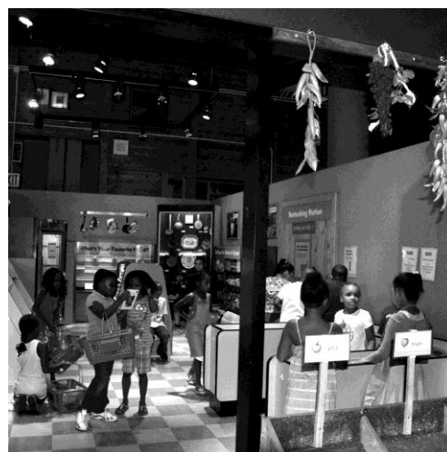
Ryc. 5. Brooklyn Children's Museum, ekspozycja codziennych zwyczajów miejskich.

lorowe neony. Tego typu rozwiązanie stymuluje kreatywność dzieci. Architekt chciał, aby wygląd budowli odzwierciedlał to, co się dzieje wewnątrz, zatem „ciągle zmagał się z pytaniem, czy budynek ma być podobny do zabawki, czy nie? (...) Dlatego jest trudny do zdefiniowania, ponieważ nie wygląda jak budynek” 7 .