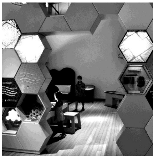
Ryc. 4. Brooklyn Children's Museum, ekspozycja interaktywna.

Fig. 3. Brooklyn Children's Museum, second floor expositions.