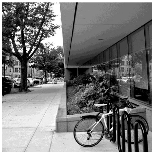
Ryc. 1. Brooklyn Children's Museum, Rafael Viñoly Architects, 2008, strefa wejściowa.

Pierwszym na świecie muzeum dla dzieci było, jak już wspomniano, Brooklyn Children's Museum, otwarte w 1899 roku. Jego idea zrodziła się w Brooklyn Institute of Art And Science. Chodziło przede wszystkim o zorganizowanie dzieciom z klasy średniej w wieku od 7 do 18 lat z pobliskiej dzielnicy Crow Hill środowiska stymulującego do obserwacji, refleksji i w ogóle do wszechstronnego rozwoju. Sukces przerósł wszelkie oczekiwania. Tysiące dzieci odwiedzało muzeum. Młodzi ludzie byli zafascynowani klawikordem Jana Sebastiana Bacha, teleskopem Galileusza czy interaktywnymi wystawami o tematyce przyrodniczej. Muzeum nie miało wtedy swojej siedziby – dopiero w 1977 roku instytucję przeniesiono do dwukondygnacyjnego budynku, zaprojektowanego przez Hardiego Holzmana Pfeiffera, przy Brooklyn Avenue i St. Mark's Avenue, w którym większość pomieszczeń znajdowała się poniżej poziomu terenu sąsiadującego z nim parku. Co znamienne, licznie powstające od lat 90. muzea dla dzieci wykorzystywały doświadczenia i rozwiązania muzeum brooklińskiego, dostrzegały też znaczenie architektury w tego typu instytucjach oraz znaczenie przestrzeni aranżowanej z myślą o dzieciach 4 .